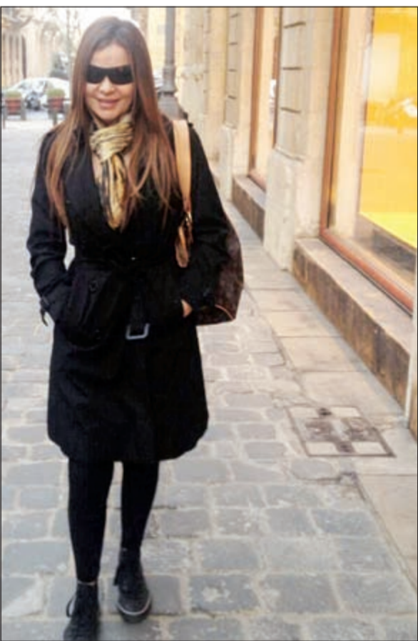
كارول سماحة بعد شفائها

طمانت الفنانة كارول سماحة الجمهور على صحتها بعد ثلاثة أشهر من إصابتها في رجلها أثناء تدريبها على استعراض «السيدة». وللمرة الأولى بعد هذه الفترة الطويلة وقفت كارول على رجليها من دون مساعدة ونشرت كارول، حسب موقع «النشرة»، صورة تظهر تعافيا واستعادة نشاطها، شاكرة د.عامر عبدالله والمعالج الفيزيائي «ميشال جانيان».