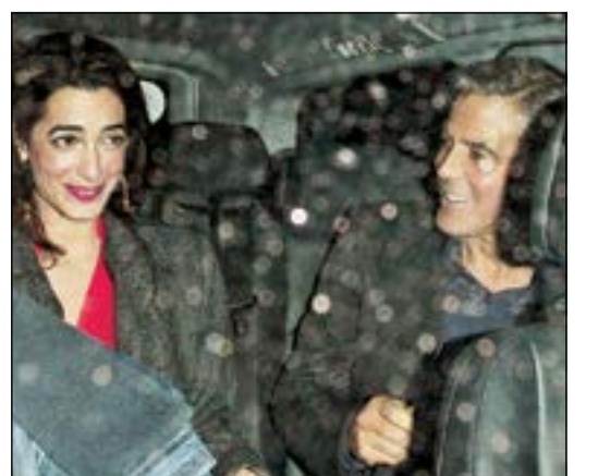
المسرة من وراء زواج سيرة كلوني في لندن وبمصحبة المحامية أمل الدين

يذكر أن كلوني الأعزب الأشهر في هوليوود ارتبط في السابق بعلاقات مع العديد من الحسناوات.