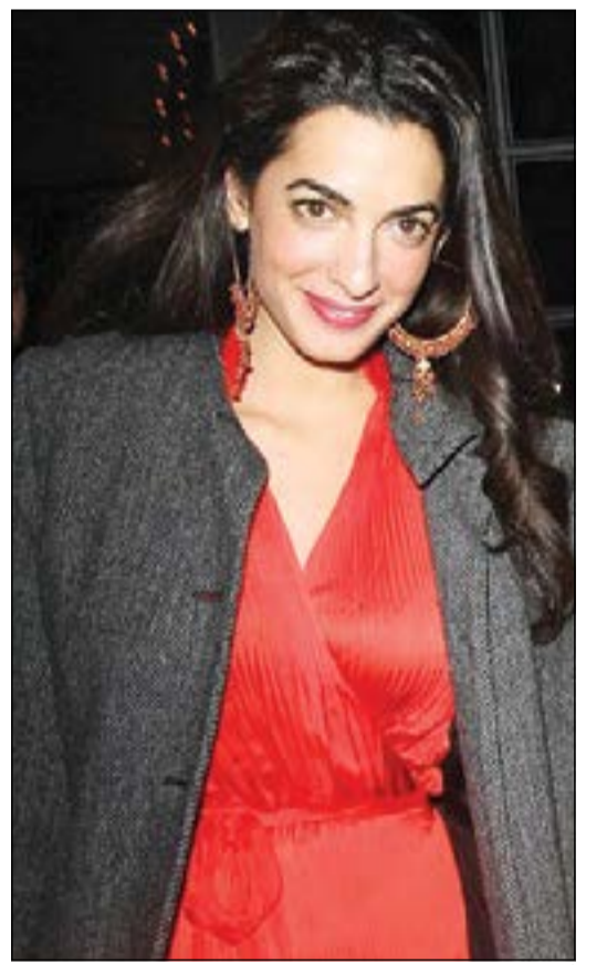
أمل علم الدين

لوس أنجليس - يو.بي.أي: تبين أن المرأة السمراء الغامضة التي شوهدت برفقة النجم الأمريكي، جورج كلوني، الأسبوع الماضي، هي المحامية البريطانية أمل علم الدين.