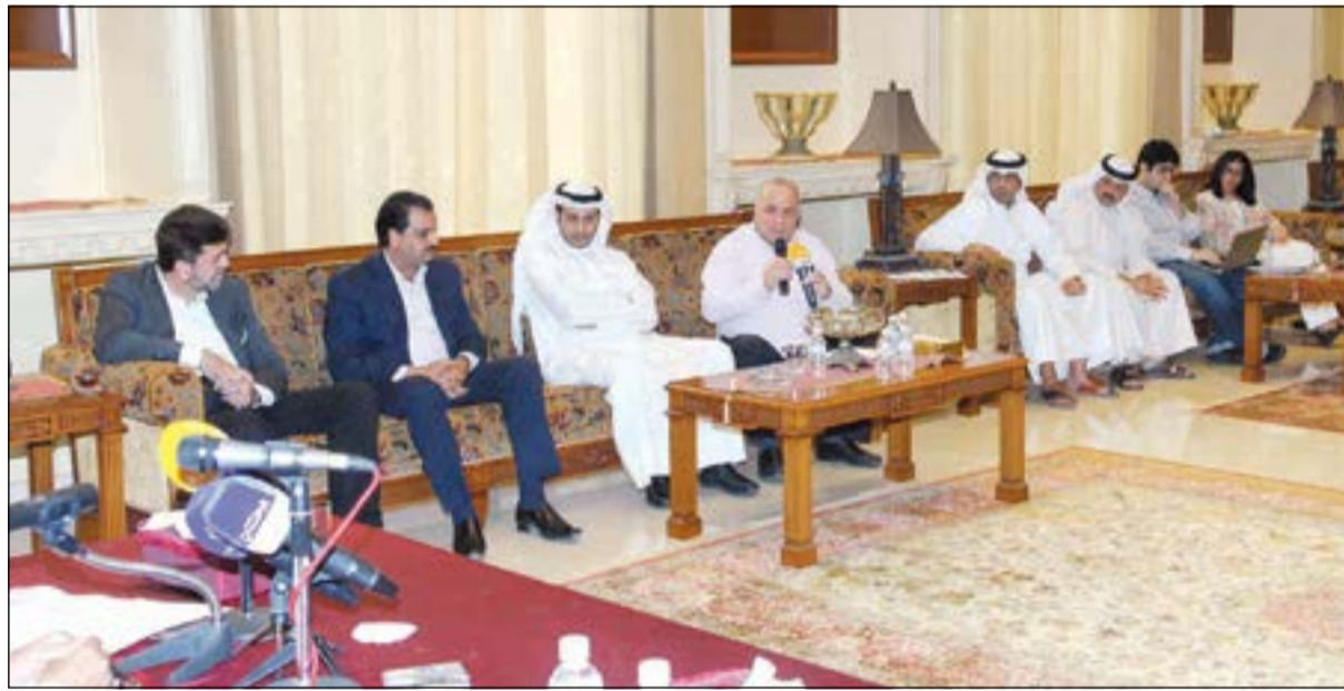
جانبا من حضور المؤتمر