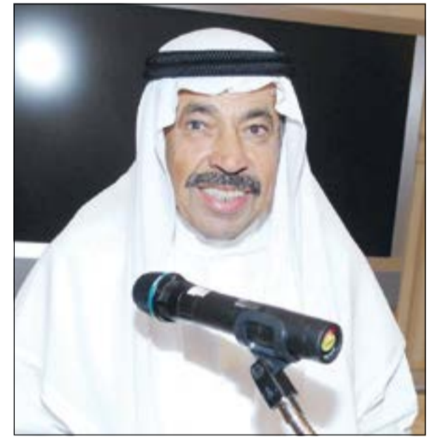
الأديب الشاعر عبدالعزيز البابطين متحدثا في المؤتمر أمس