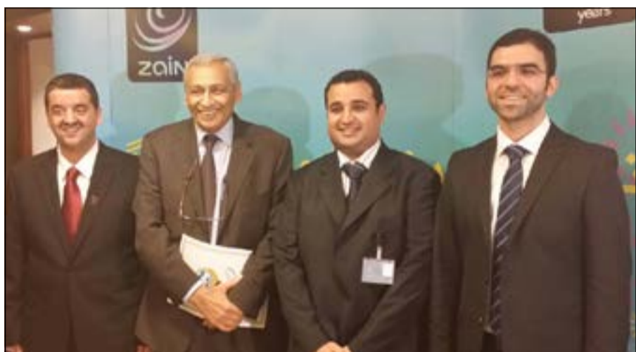
زيارة سفير الكويت في بريطانيا خالد الدويسان لجناب «زين»

وأكد الخشتي أن «لدينا ثقة وبقينا أنكم تعكسون وجه الكويت الحضاري فانتهم مرة نغية لسلوك وأخلاق الشعب الكويتي الأصل، ونحن إذ نجدد عهدنا بمساندة نشاطات العملية التعليمية لسبابنا الواعد في كل مكان، فإننا حريصون على