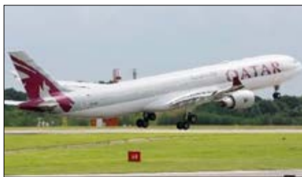
أحدى ناقلات «القطرية» للطيران

الاتحاد ون وورلد في نيويورك في أكتوبر 2012، حيث تعد هذه أسرع عملية انضمام في تاريخ الاتحاد وعادة تستغرق عملية الانضمام إليه 18 شهراً. ويأتي انضمام القطرية إلى اتحاد «ون وورلد» قبل انتقالها إلى مقرها الجديد في مطار حمد الدولي الذي سيعزز موقع الدوحة كمقر رئيسي وعالي للطيران ويتمتع بقدرة استيعابية ستصل تدريجياً إلى 50 مليون مسافر سنوياً. وسيحتل مسافرو الخطوط