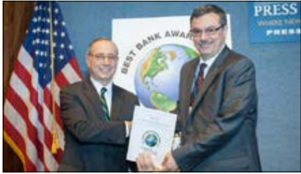
أفق أيوان «يمين» يتسلم الجائزة

وشدد أيوان على أن «بيتك - تركيا» نجح في زيادة ودائع العملاء مع التوسع في إدارة الأصول والثروات وزيادة