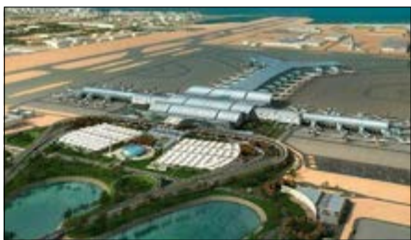
مطار حمد الدولي الجديد

بتصنيف الخمس نجوم من مؤسسة سكاى تراكس، حازت موافقة مجلس «ون وورلد» بعد اجتيازها مرحلة اختبار جاهزيتها الذي أجراه وأشرف عليه الطيران البريطاني - الراعي لعملية انضمام القطرية إلى اتحاد ون وورلد - بالتعاون مع الفريق المركزي للاتحاد. واتمت «القطرية» إجراءات انضمامها إلى اتحاد ون وورلد بعد عام فقط من تلقيها الدعوة التي تم الإعلان عنها خلال مؤتمر صحفي عقد في مقر