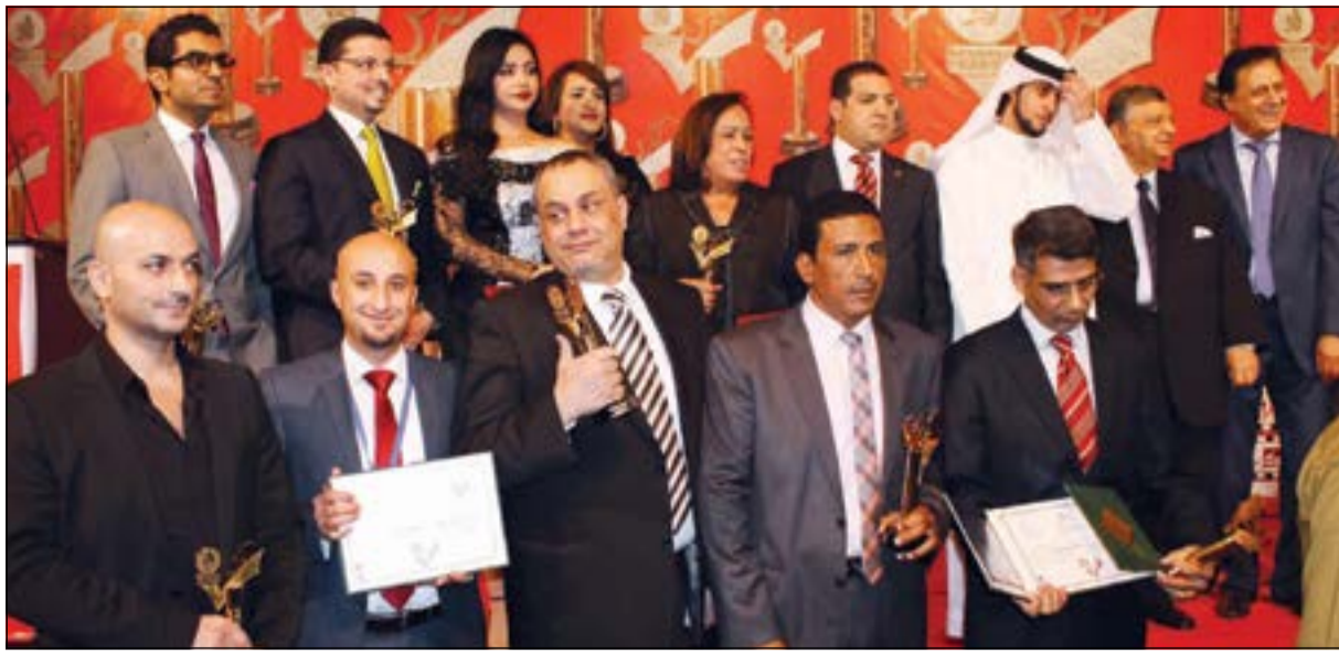
صورة جماعية للمكرمين