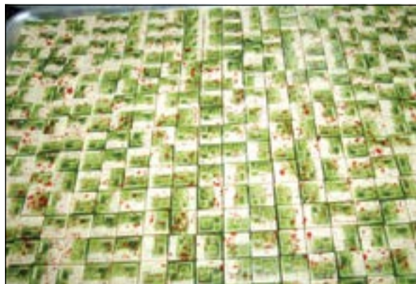
..ونوع آخر من الحلويات