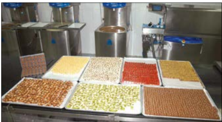
تمتاز لازورد بتنوعها