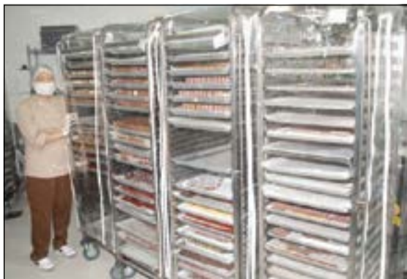
المخبروات وقد تمت تغطيتها