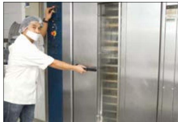
مراحل تجهيز المخبروات