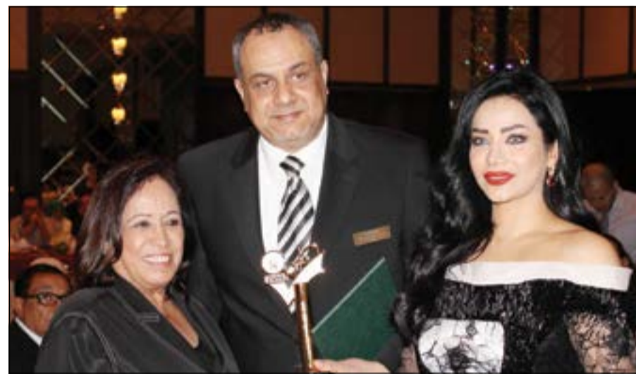
العبد متوسطة الفنانة الكبيرة حياة الفهد والإعلامية لجن عمران

تقوم لازورد بتلبية جميع الحفلات والمناسبات من خلال فريق عمل متكامل مؤهل ومدرب تم تزويده بجميع المعدات والتجهيزات اللازمة، وذلك من خلال أسطول متكامل من السيارات والبرادات لتلبية جميع الطلبات ولتسهيل الوصول بأسرع وقت إلى جميع مناطق الكويت حيث أننا نمتلك 25 سيارة نقل مجهزة بالكامل وكما تم إعداد قوائم طعام تناسب جميع المناسبات والأذواق مع إعطاء العميل