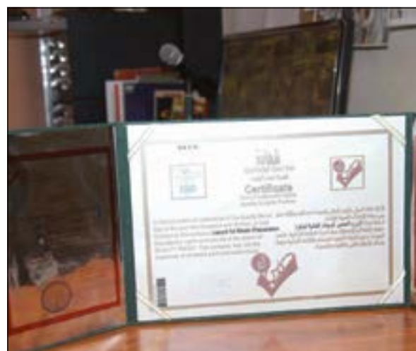
شهادة فرسان الجودة