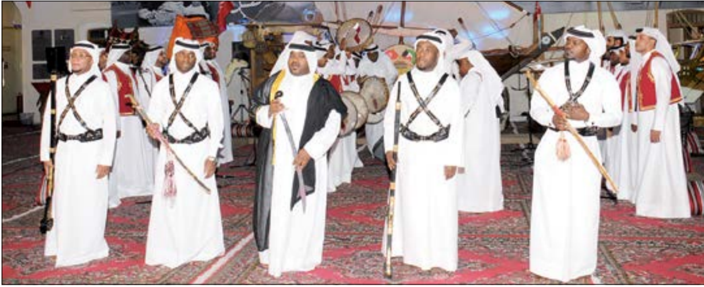
فقره فلكلورية قطرية