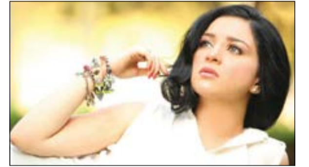
مي عز الدين

نفت النجمة الشابة مي عز الدين شائعة زواجها واعتزالها التمثيل، مؤكدة