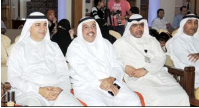
الأمين العام للمجلس الوطني م.علي البوحة وعدد من الضيوف أثناء الحفل