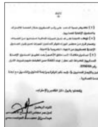
صورة زنگرافية لكتاب أمين سر مجلس الدفاع الأعلى إلى مدير عام التأمينات

العليا بعد خدمة 25 سنة فعلية وتوفير حياة كريمة لهم بعد التقاعد نظراً للانخفاض الكبير في الراتب. وأشار إلى أن المقترح ينص على تخفيض نسبة الخصم على راتب العسكريين خلال الخدمة للاشتراك بال صندوق الإضافي للعسكريين، مؤكداً استمرار الميزات الحالية لمستحقيها من الضباط وإصدار قرار من مجلس الوزراء لاستمرار الميزات لحين إقرار الصندوق الإضافي للعسكريين من الجهات التشريعية في الدولة مع استمرار مكافأة الاستحقاق 24 شهراً بعد تطبيق الصندوق الإضافي للعسكريين لضباط المستحقين لهذه المكافأة من انطبقت عليهم شروط القرار رقم 2008/495.