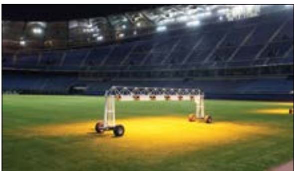
الشمس البديلة تم توريدها للحفظ على حيوية العشب