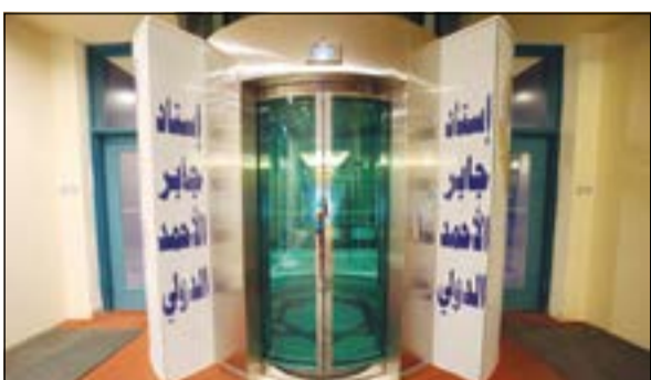
المسعد الخاص بكبار الشخصيات