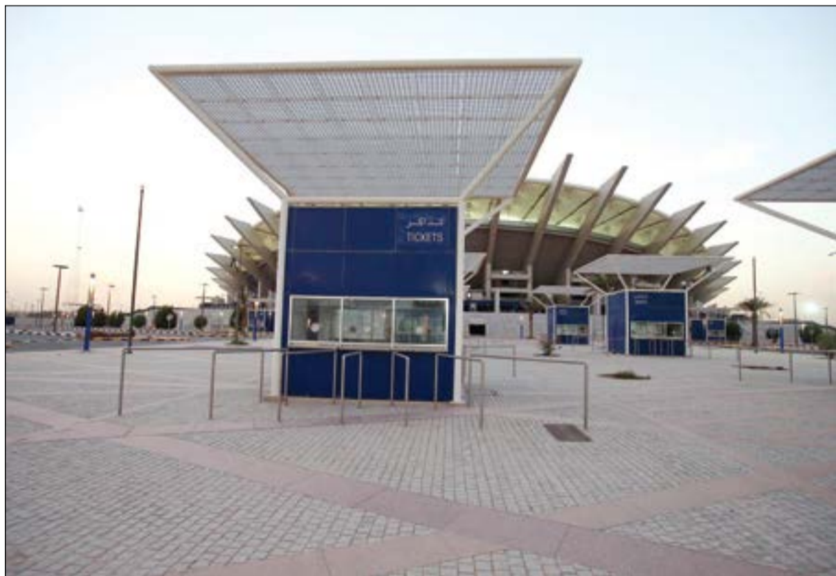
واحدة من 12 كابينة لحجز التذاكر في الملعب

عبر كرت ممغنط وحيد يسلم إلى مدير الفريق قبل المباراة، وإلى جانبها الحمامات الخاصة للاعبين والجاكوزي وصالتان للاحمام فرشتا بالعشب الصناعي، أما الأرضية فبذبت متساوية تماماً بعد أن أعيدت زراعتها بأسلوب حديث واختفت النتوءات التي كانت في السابق وانتهى العمل منها بشكل