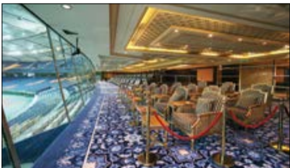
القاعة الأميرية تم الانتهاء من تأثيثها