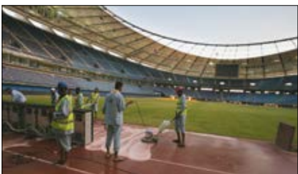
عمليات النظافة جارية بشكل يومي وعلى مدار الساعة

الستاد بعد التعاقد مع إحدى الشركات الخاصة بمجال التنظيف.