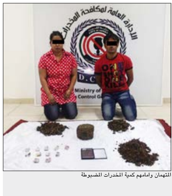
التهمان وامامهم كمية المخدرات المضبوطة

تمكنت إدارة مكافحة المحلية التابعة للإدارة العامة لمكافحة المخدرات والتي يرأسها العميد صالح الغنام من ضبط أسويي بحوزته كيلو غرام من مادة الماريغونا، وكمية من مادة الأيس معدة ومهياة للبيع. وكانت المعلومات الواردة أفادت بوجود أسويي يحوز مواد مخدرة بقصد الاتجار، وبناء على تلك المعلومات تم تكثيف التحريات، وبعد التأكد من صحتها تم اتخاذ الإجراء القانوني اللازم، وتم ضبطه داخل مسكنه وبفتيش مسكنه عثر على تلك المضبوطات، وبمواجهته بما نسب إليه أقر واعترف بالواقعة وحيازته لتلك المواد المخدرة بقصد الاتجار، مؤكداً أنه يحصل عليها من أفدة أسويية، وعلى الفور تمت مداممة مسكنها وبفتيشه عثر على ما يقارب 3 كيلو غرامات من مادة الماريغونا المخدرة. هذا، وقد تمت إحالتهم والمضبوطات إلى جهة الاختصاص.