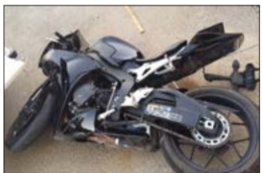
الدراجة التي تركها المتهمون في موقع الحادث

قال مصدر أمني أن المتهمين في حادثة عبدالله المبارك، والتي انفردت «الانباء» بنشرها، وكانوا يستغلون دراجتين ناريتين لم يكتفوا بالهرب وترك دراجتهم التي اصطدموا بها بدورية الأمن، بل قاموا باستخدام الأسلحة البيضاء «سكين» وطعن ملازم أول وكسر يد عسكري يعمل في مخفر عبدالله المبارك وتم تسجيل قضية وتمت إحالة ملفها إلى رجال المباحث.