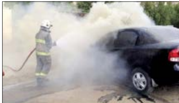
إخماد حريق المركبة