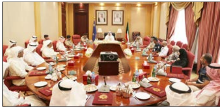
وزير الداخلية الشيخ محمد خالد مجتمعا بضباط الجنائية

للمباحث الجنائية بالنيابة العميد وليد الدين ومدير ادارة مباحث حولي العقيد عبدالرحمن الصهيل وعدد من الضباط وضباط الصف والافراد والمدنيين من المباحث الجنائية والادلة الجنائية الذين شاركوا في عمليات البحث والتحري وكشف الادلة التي ادت إلى سرعة وملاحقة وضبط الجاني حيث استمع الخالد لتقارير مفصلة عن ذلك.