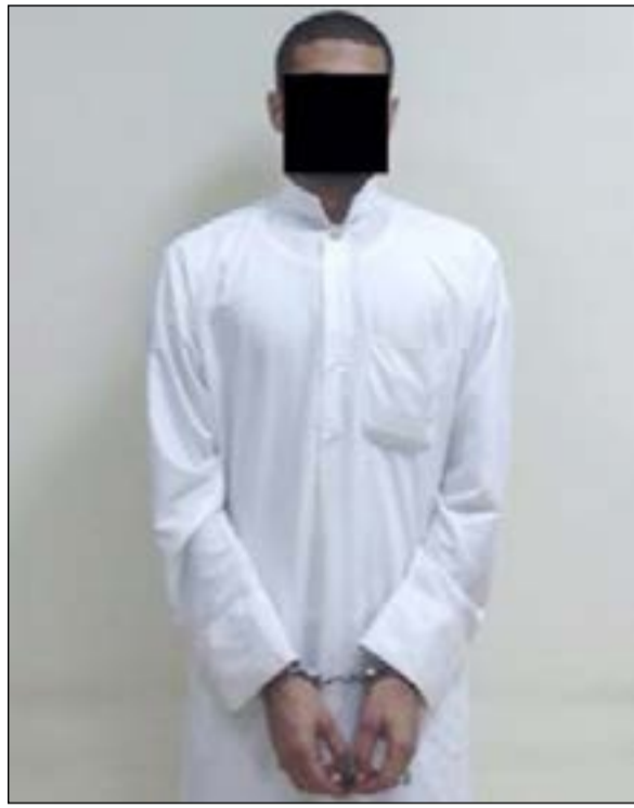
المتهم بحرق المصاحف