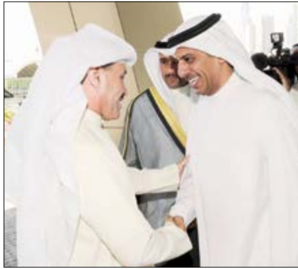
محمد طنا مهنتا مهلهل الخالد