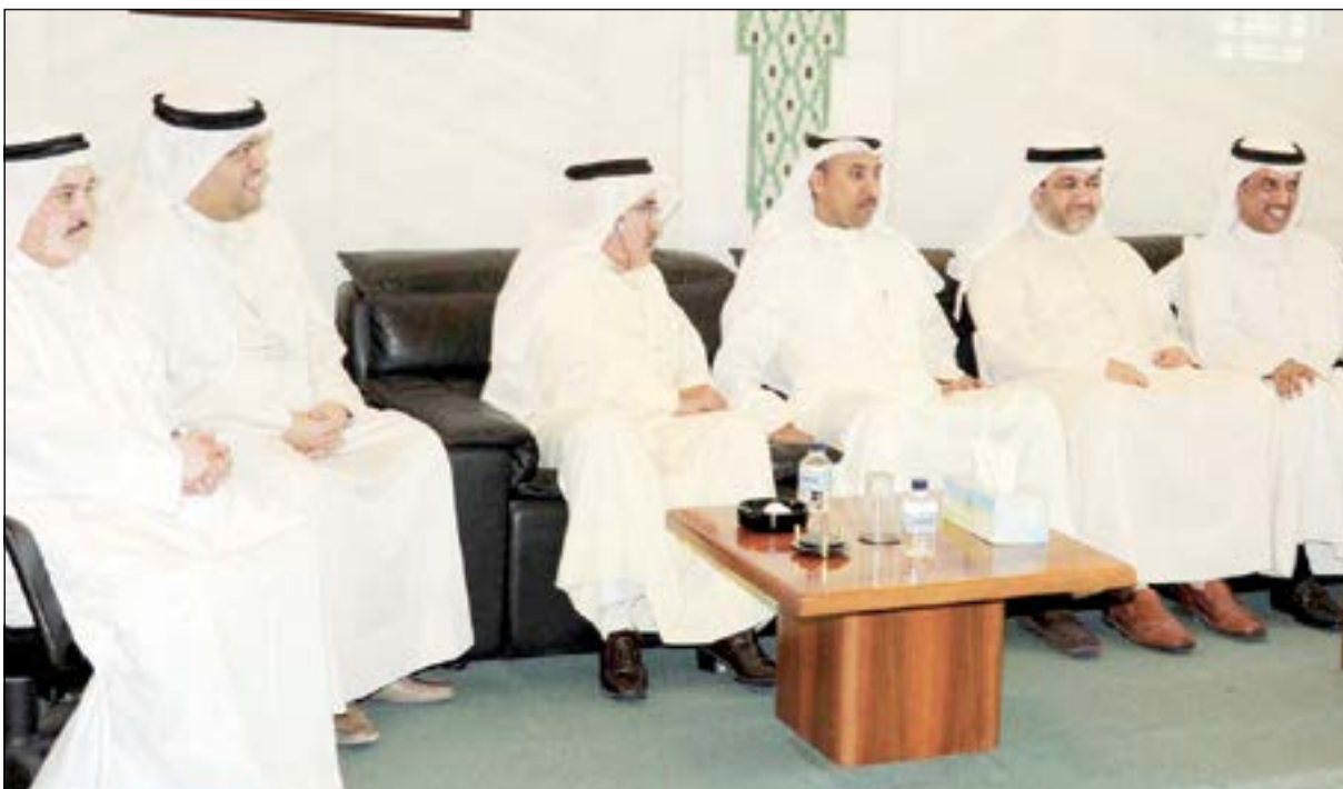
جانبا من الحضور

قال النائب كامل العوضي إن المواطنين «زهقوا» من الانتخابات والنواب، لذلك لابد من التعاون لأن أهل الكويت ملوا، وقال إن المجلس الماضي حصلت فيها صراعات وحاليا ستصدر قرارات وقوانين تصب في مصلحة البلاد في ظل وجود العقول والأموال. وأكد أن إنشاء المدن سيحل 30% من المشاكل المتعلقة خاصة الاندحام المروري الذي سيقل، وكذلك إيجاد فرص عمل جديدة، مؤكدا أن المجلس البلدي لا يقل أهمية عن غيره من المجالس.