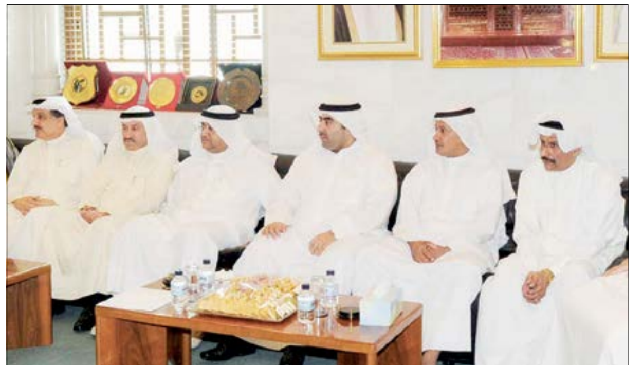
عدد من الأعضاء الذين حضروا اللقاء