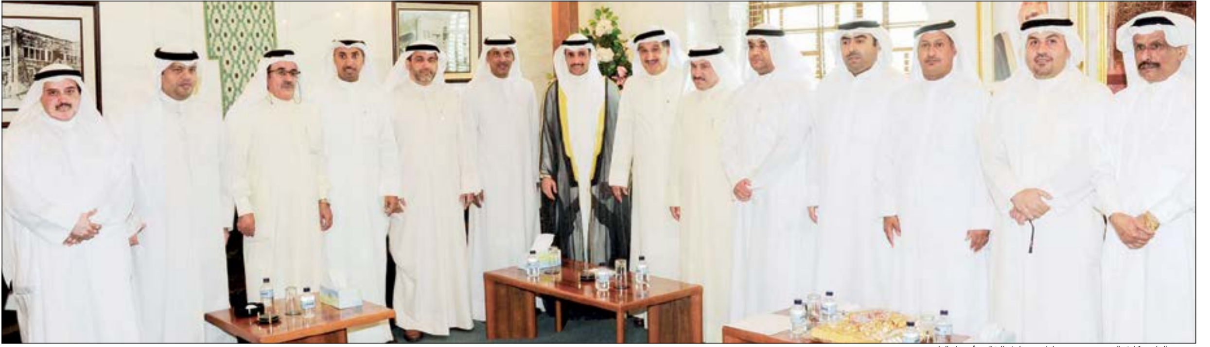
مرزوق الغانم وكامل العوضي ومحمد طنا مع مهلهل الخالد وأعضاء البلدي

أكد أن هناك أولويات للعمل أبرزها حل المشكلة الإسكانية