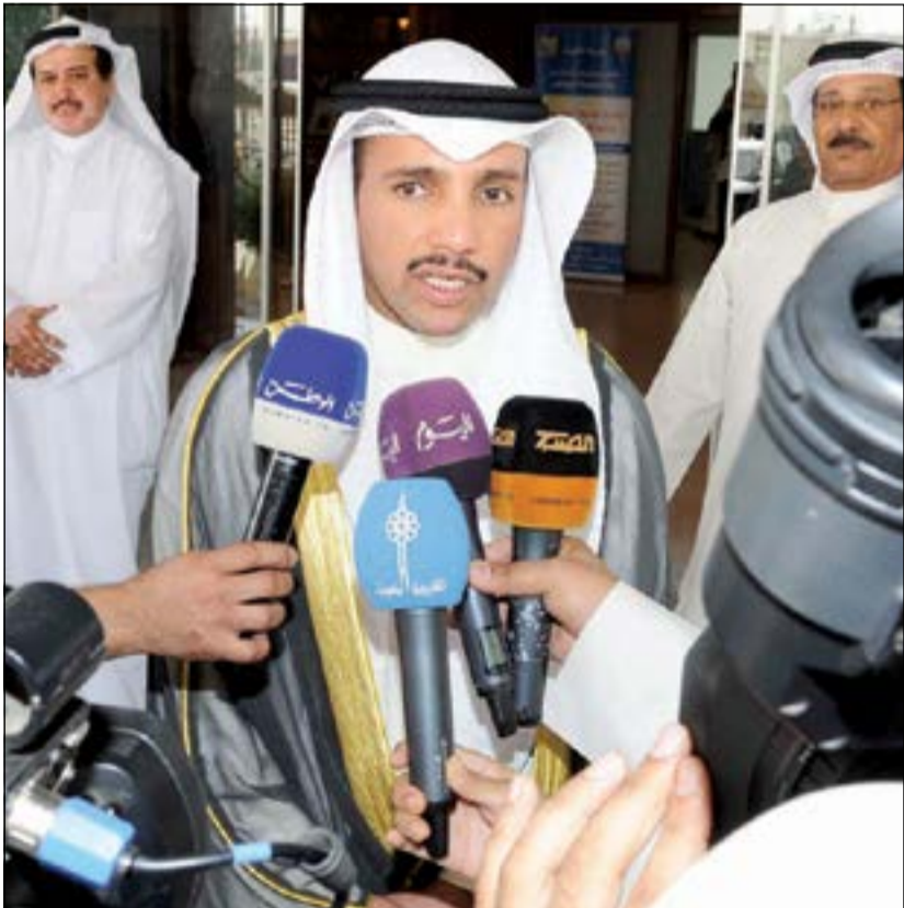
مرزوق الغانم متحدثا إلى الصحافيين

الخالد: تعديل القوانين لحل المشكلة الإسكانية كمال: علينا استثمار الموارد البشرية والمالية الموجودة الفضالة: التركيز على القطاع الخاص للمساهمة في حل القضية الإسكانية العتيبي: ضرورة تعديل القصور في بعض التشريعات الجويسري: التعاون بين أعضاء المجلسين لمصلحة البلاد الصانع: وجود حلقة مفقودة بين الرعاية السكنية والبلدي