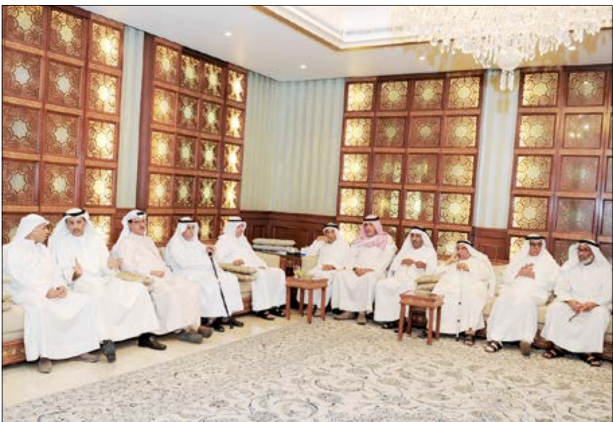
جانبا من المهنتين في ديوان الخالد