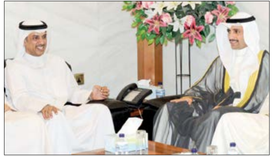
جانبا من اللقاء بين الغانم والخالد

التعاون بين مجلس الأمة والبلدي لخدمة البلد. وأضاف نقول لكم «الله يعينكم ويعيننا على المسؤولية الملقاة على عاتقنا». من جانبه أكد رئيس المجلس البلدي مهلهل الخالد شكره وتقديره لرئيس مجلس الأمة مرزوق الغانم والنائبين كامل العوضي ومحمد طنا على زيارتهما وإخوانه أعضاء المجلس. وأشار إلى أهمية تعديل بعض القوانين من أجل حل المشكلة الإسكانية التي أصبحت تؤرق كل مواطن، مؤكدا على التعاون بين جميع السلطات من أجل إيجاد العوامل التي تساهم في سرعة توفير الأراضي لأصحاب الطلبات الإسكانية. وأضاف الخالد أن مواد قانون البلدية (2005/5)، تحتاج إلى مزيد من الدراسة والتعديل وذلك بالتعاون مع النواب من أجل المصلحة العامة. من جهته قال عضو المجلس البلدي د.حسن كمال إن أعضاء مجلس الأمة والبلدي مكملا لبعضهما البعض ولذلك لابد من إيجاد الحلول المناسبة للمشكلة الإسكانية، مشيرا إلى أن قيام المجلس البلدي بعمل أولويات تصب في مصلحة الكويت. وأشار إلى أن الموارد البشرية والمالية متوافرة وعلينا استثمارها في البلاد بدلا من الذهاب للعمل في الخارج. كما دعا عضو المجلس البلدي أحمد الفضالة إلى التركيز على القطاع الخاص في المساهمة بحل المشكلة الإسكانية، ومن شروط قيود محدودة، مؤكدا أنه لا توجد أي مشكلات في البلاد وأن ما ينقصنا هو الإدارة الهندسية المتقنة. من جهته قال نائب رئيس المجلس البلدي مشعل الجويسري إن هناك مشاكل عديدة يعاني منها المواطنون وهي الصحة والتوظيف إضافة إلى الأولوية الرئيسية والمتعلقة بالمشكلة الإسكانية، مؤكدا تعاون الأعضاء مع النواب لمصلحة البلد. من جهته، بين عضو المجلس البلدي أسامة العتيبي استعداد