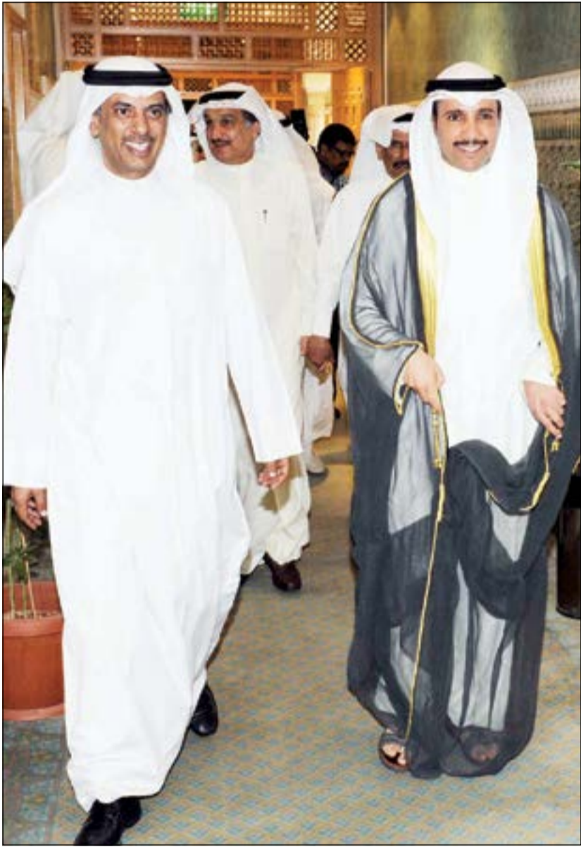
رئيس المجلس البلدي مهلهل الخالد مرحبا برئيس مجلس الأمة مرزوق الغانم