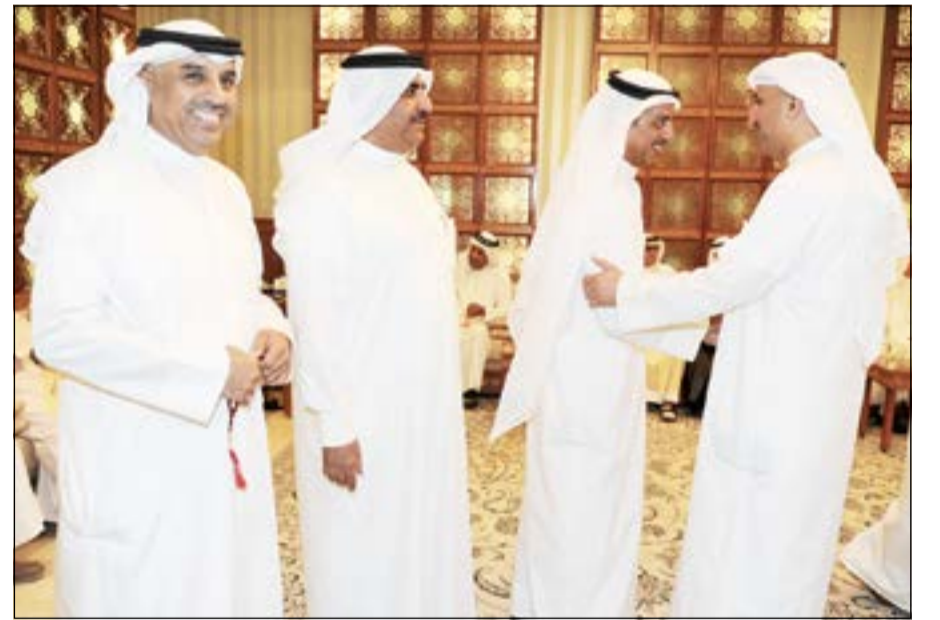
حديث باسم بين الخالد وعدد من المهنتين