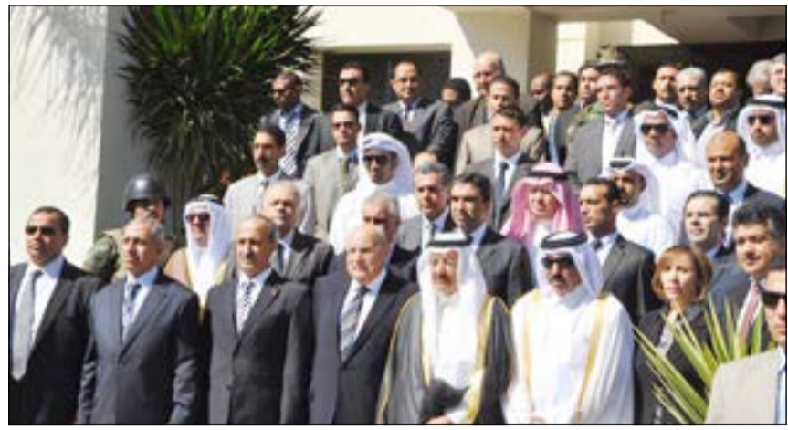
جانب من المشاركين في الاجتماع

على سرعة الانتهاء من دراسة الانضمام إلى اتفاقية العمل البحري الدولية لحفظ حقوق العمالة البحرية العربية وملاك السفن، بالإضافة إلى ما ستقدمه الاتفاقية من تسهيل لإجراءات السفن العربية في موانئ الدول الأخرى. وفيما يتعلق بالقواعد الاستثمارية الموحدة التي تستعين بها الدول العربية للتفاوض مع الاتحاد الأوروبي والدول الأعضاء فيه كلف المجلس الأمانة العامة بتعميم تلك القواعد التي أعدتها الهيئة العربية للطيران المدني لتستعين بها الدول العربية عند تفاوضها ثنائيا فيما بينها وبين الكتلة الأوروبية.