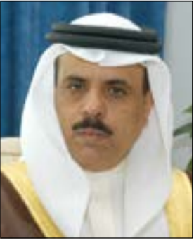
د. ماجد النعيمي

واعتبر ان غياب الإرادة السياسية لعدد من الدول الرئيسية فيه جسد تحديا وعاثا كبيرا أدى إلى تعطيله من خلال عدم التوافق على جدول أعمال محدد. وأكد انه وعلى الرغم من تلك التحديات فإن الكويت ترحب بقرار مؤتمر نزع السلاح القاضي بإنشاء فريق عامل غير رسمي تسند اليه ولاية وضع برنامج عمل قوي لضمان تنفيذ تدريجيا وفق مدى زمني. وأعرب عن أمله في ان تسفر جهود هذا الفريق عن التوصل إلى توافق بالآراء يتيح للمؤتمر في اقرب وقت ممكن البدء في تناول القضايا الرئيسية المدرجة على جدول الأعمال منذ أكثر من 15 عاما.