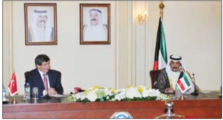
الشيخ صباح الخالد وأحمد داود أوغلو خلال المؤتمر الصحفي (هاني عبدالله)

سيطرت الأزمة السورية على أجواء المؤتمر الصحفي الذي عقده نائب رئيس مجلس الوزراء ووزير الخارجية الشيخ صباح الخالد مع نظيره التركي أحمد داود أوغلو ظهر أمس في مقر وزارة الخارجية بمناسبة انعقاد الاجتماع الأول للجنة العليا المشتركة بين البلدين والذي ناقشا خلاله تعزيز سبل التعاون بين البلدين في مجالات مختلفة.