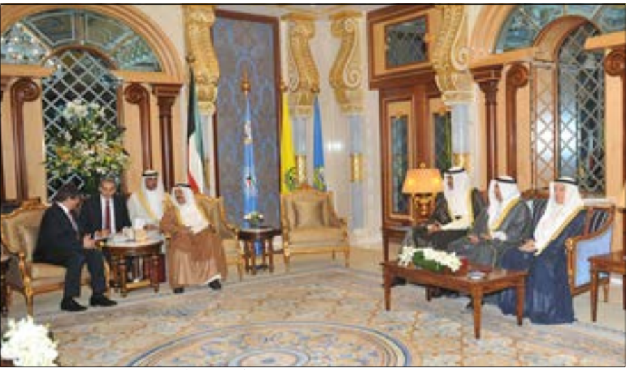
صاحب السمو الأمير الشيخ صباح الاحمد مستقبلا وزير خارجية تركيا احمد داود اوغلو