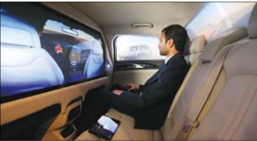
«لينكولن» MKZ وفرت تجربة فريدة في المقعد الخلفي للزوار

ويتم ذلك عبر استخدام 10 أجهزة عرض بقوة 500 لومن لكل منها للعرض على النوافذ، وبرنامج ليزر مطابق للمعايير العسكرية لأجهزة التحكم العاملة باللمس وحركات اليد، ونظام تكامل ثنائي الاتجاه مع شبكات التواصل على غرار «تويتر» و«فيسبوك». كما تم تصميم التطبيق المخصص للتحكم في التجربة لتسجيل بيانات العمل عندما ينهي الزائر التجربة، ويتم نقل البيانات إلى الوكيل و«لينكولن» على حد سواء في حال طلب الزائر إجراء قيادة تجريبية فعلية. من جهة أخرى، تتميز المقصورة العجلة بمكيف هواء مخصص لا يتطلب تشغيل المحرك ليعمل، بالإضافة إلى وحدة لتبديد الحرارة من أجل تحويل الحرارة الناجمة عن أجهزة العرض إلى خارج السيارة. وبدعم هذا النظام تمديدات كهربائية هائلة ونظام دعم احتياطي كامل، وكلاهما مخفيان ولا يمكن رؤيتهما. يمكن إيجاد منصة لينكولن في القاعة 3 من مركز دبي التجاري العالمي خلال أسبوع «جايتكس» للتكنولوجيا.