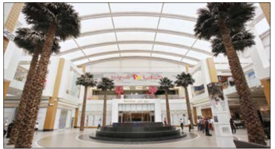
مدخل ركن المجوهرات من منطقة المول

يفوق عددها 26 متجرًا أبرزها: متجر دالماس للمجوهرات، لورينزو، باباراتزي، بيور للمجوهرات، توسكانا، فان ديرباودي، بيغيل، زوبيني، العوضي للمجوهرات، أنطوان حكيم، كاتشي، ديفا للمجوهرات، جوفال، كاليستا، لازوردي، ماي فير لبيدي للمجوهرات، سيلفراما، ياسيان، تانغو، تيلوس، جوهر، صغير آرت، مجوهرات نور المسية، وأخيراً ركن للمجوهرات.