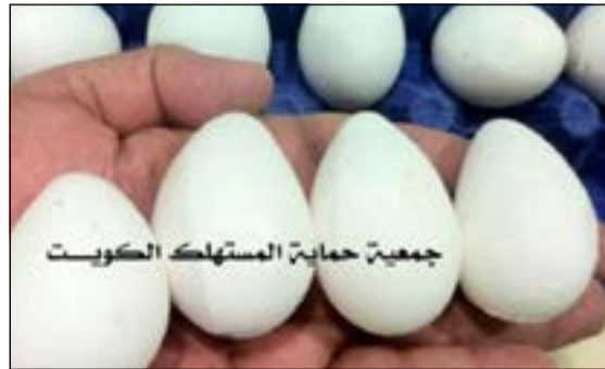
اشكال مشوهة للبيض تخالف المعايير الصحية لهذا المنتج الاساسي

كشفت إحصائية صادرة عن وزارة الشؤون للفترة الزمنية من 2013/1/1 إلى 2013/10/20، أن عدد الإناث العاملات في القطاع الأهلي من الوافدات وصل إلى 102047 عاملة مسجلة في