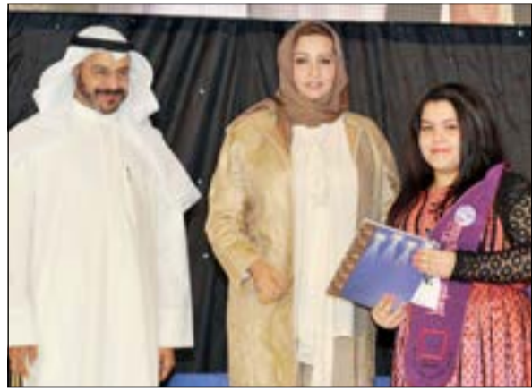
ذكرى الرشيدى تكرم ابنة ناصر الصانع بحضوره

وأضافت في كلمة لها خلال رعايتها حفل تكريم 1129 طالباً وطالبة من متفوقين ومتفوقات منطقتي الروضة وحولي في الحفل الذي نظمته جمعية الروضة وحولي التعاونية في قاعة الراجية، أنه لا يخفى على أحد أن رعاية أبنائنا الطلبة تحتل جزءاً كبيراً من اهتمامات الحكومة، وذلك واضح من برنامج عمل الحكومة وخطة التنمية وذلك إيماناً منها بأن الاستثمار الدائم والباقي هو الاستثمار في ثروتها البشرية. وتابعت أن هذا الهدف أكد عليه صاحب السمو الأمير الشيخ صباح الأحمد في النطق السامي لسموه في افتتاح دور الانعقاد العادي الأول من الفصل التشريعي الرابع عشر لمجلس الأمة بقوله: «إنكم الطاقة المحركة للتنمية أي مجتمع وارتقائه وأنتم أساس أمنه واستقراره والثروة الباقية وأنتم نصف الحاضر وكل المستقبل وأنتم أعمدة النهضة المقبلة ولن نخلع عليكم بجهد أو مال لتتحملوا مسؤوليتكم كاملة تجاه وطنكم». من جانبه، قال رئيس مجلس إدارة جمعية الروضة وحولي التعاونية طارق