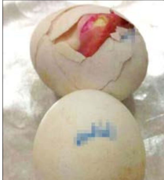
بيض «مفرخ» - بد «صوص»