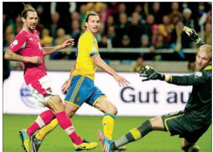
إبراهيموفيتش يسجل في لقاء سابق أمام البرتغال

سستكونان مذهلتين. نحن نواجه فريقا جيدا يضم الكثير من اللاعبين الجيدين. مباريات الملحق هما بمنزلة مباراتين نهائيتين: انتهما مختلفتان تماما عن مباريات دور المجموعات». وأضاف لاعب سان جرمان الذي غاب عن اللقاء الأخير لجلده ضد ألمانيا (5-3): «أعتقد أنه علينا تقليل أخطائنا. الفريق الذي سيرتكب عددا أكبر من الأخطاء سيغيب عن كأس العالم...». وسيتعين على كريستيانو وإبراهيموفيتش خوض ربما فرصة أخيرة