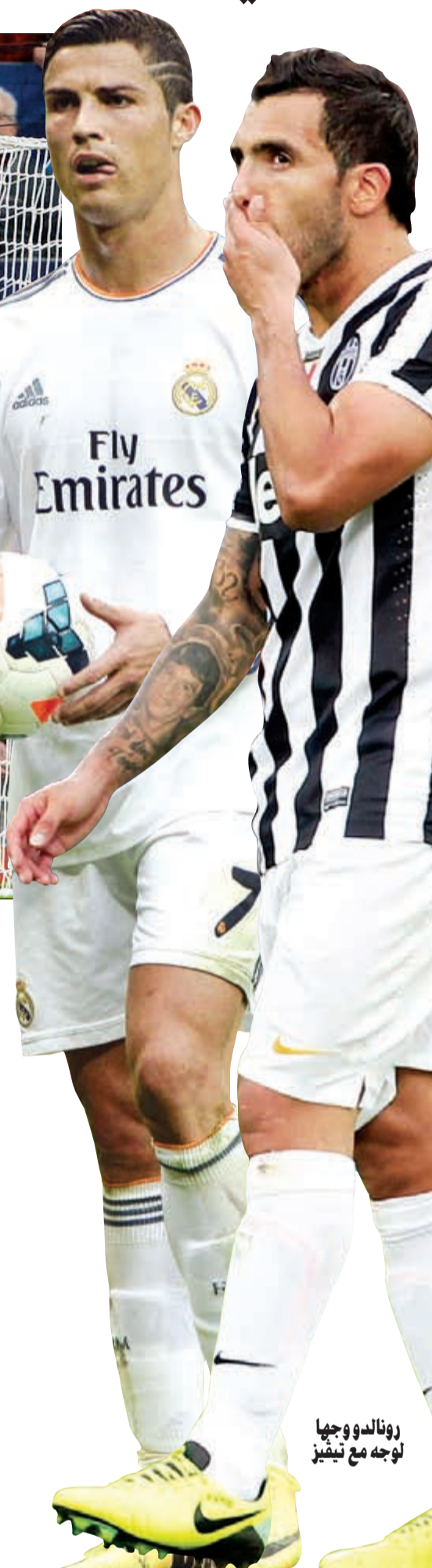
رونالدو وجهها لوجه مع تيفيز

تتجه الانظار اليوم الى ملعب «سانتياغو برنابيو» الذي يحتضن موقعة تاريخية بين ريال مدريد الإسباني، حامل الرقم القياسي بعدد الألقاب (9 آخرها عام 2002)، وضيفه يوفنتوس الإيطالي في وقت يخوض فيه بايرن ميونخ الألماني بطل الموسم الماضي اختبارا سهلا على أرضه، وذلك في الجولة الثالثة من منافسات الدور الأول لمسابقة دوري أبطال أوروبا لكرة القدم، فسي المجموعة الثانية، يدخل يوفنتوس إلى موقعه مع ضيفه ريال مدريد وظهرو