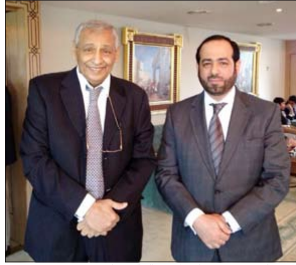
السفير السبيعي وسفيرنا في لندن خالد الدويسان

من جانبه، قال السفير عبدالعزيز السبيعي الرئيس الفخري لاتحاد سفراء الطفولة العرب خلال كلمته بالحفل: جئنا الى هنا من أجل الدفاع عن حقوق آلاف الأطفال في فلسطين وغيرها من أجل تحسين أوضاعهم ليتمتعوا بقدر من الحياة الكريمة.