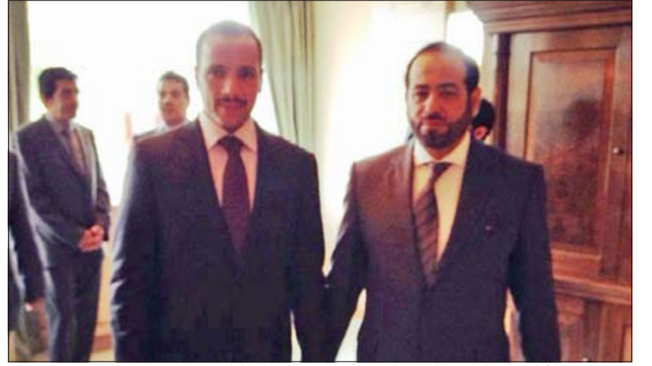
رئيس مجلس الأمة مرزوق الغانم مع الرئيس الفخري لاتحاد سفراء الطفولة العرب عبدالعزيز السبيعي

رئيس جمعية الهلال الأحمر الكويتية. وهنا الغانم الحضور بالعيد، مشيراً الى ان هذه المناسبات فرصة طيبة للتأخي والتصالح بين كل أبناء الوطن العربي والإسلامي والعمل سوياً من أجل مستقبل الاجيال الواعدة، وفي كلمته بالحفل