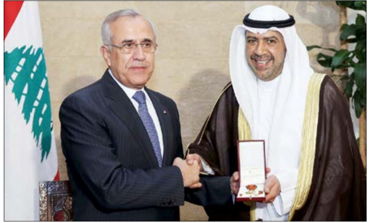
الرئيس اللبناني ميشال سليمان يسلم الشيخ أحمد الفهد وسام الأرز ويصافحه في قصر بعيدا

تقديرًا لمواقفه الداعمة للرياضة اللبنانية