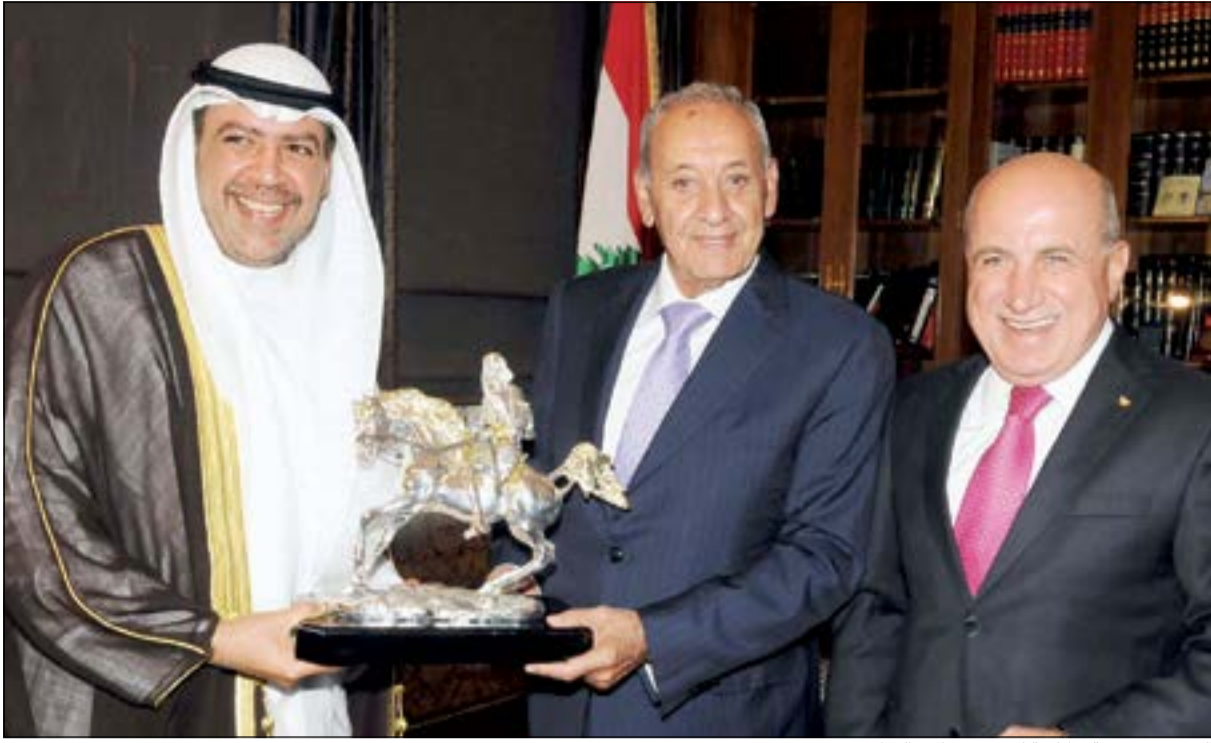
الفهد يقدم هدية تذكارية لرئيس مجلس النواب نبيه بري