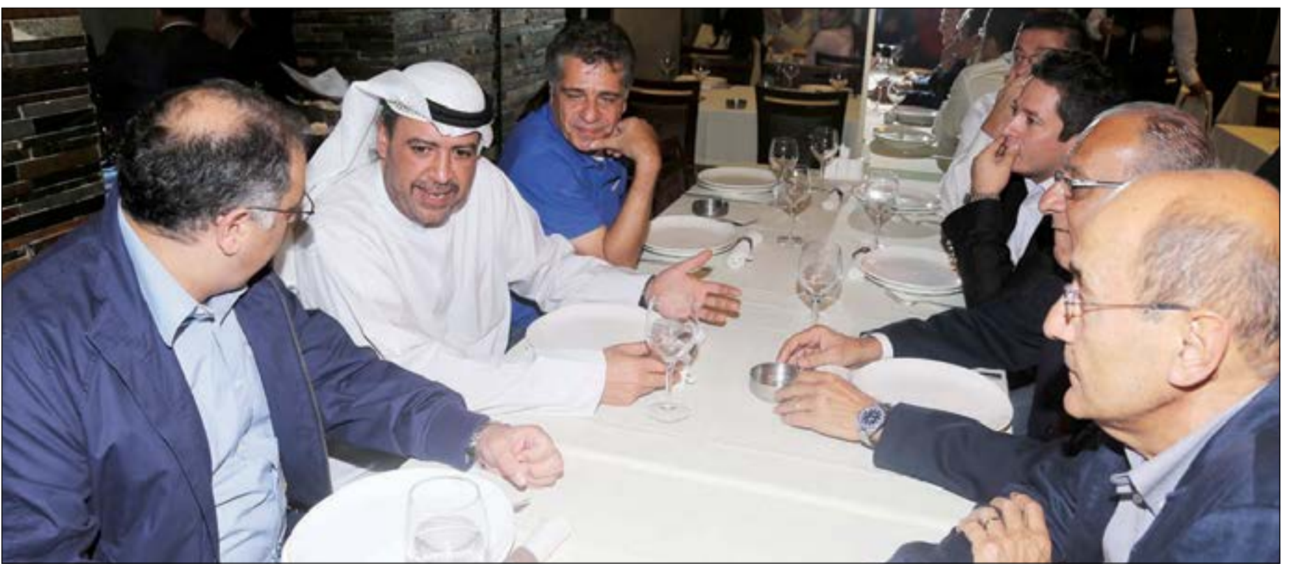
(عدنان الحاج علي)

خصص الشيخ أحمد الفهد رئيس المجلس الأولمبي الآسيوي، القسم الأخير من العشاء التكريمي الذي أقيم على شرفه في مطعم «السلطان ابراهيم» بوسط بيروت قرب قصر الرئيس سعد الحريري «بيت الوسط» في وادي ابو جميل، للقاء الإعلاميين الرياضيين اللبنانيين مستجيبا لطلب «الأنباء» بكل طيب خاطر. وتوجه إلى الطاولة التي ضمت رؤساء الاقسام الرياضية في الصحف اللبنانية، واستهل الكلام بتتمين لسقاعات لبنان والازرق في كرة القدم التي تفتك كلها عند نقطة التعادل في فوز كل من المنتخبين وتعادلهما وعدد الاصابات