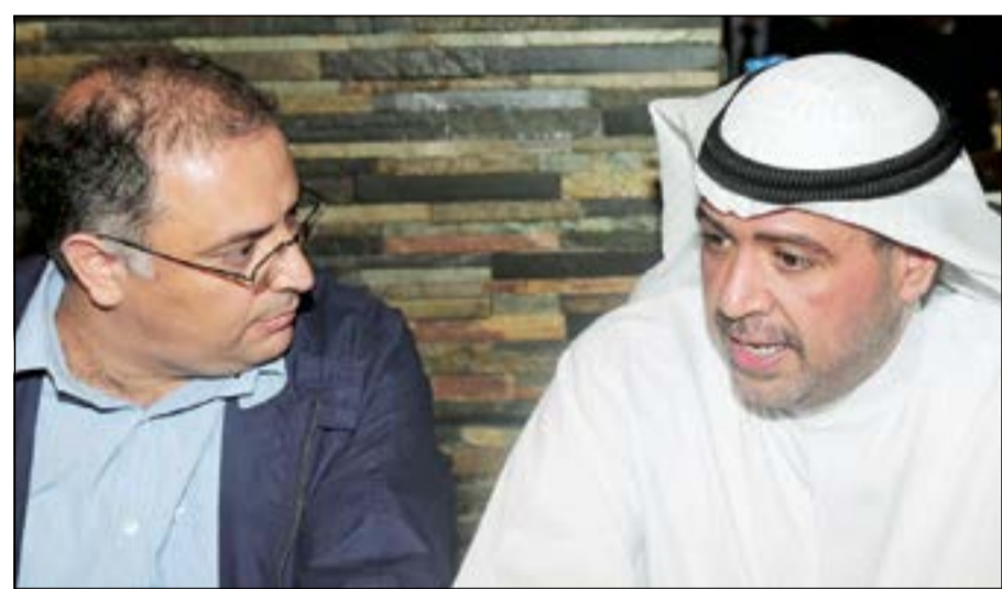
الشيخ أحمد الفهد يتحدث للزميل ناجي شربل

ثم رد على اسئلة «الأنباء» التي تناولت الشائعات الكويتية وقال ان انتخابات الاتحاد الكويتي لكرة القدم ستجرى بانتخاب 14 عضوا في اللجنة التنفيذية، بعدما استجاب «فيفا» لطلب الاتحاد الكويتي، «وبذلك يكون الاتحاد أبر بالوعد الذي قطعه رئيسه الشيخ طلال الفهد لصاحب السمو الأمير الشيخ صباح الأحمد، الحريص على تمثيل العائلة الرياضية وتغليب الوحدة ومصصلحة الكويت في كل