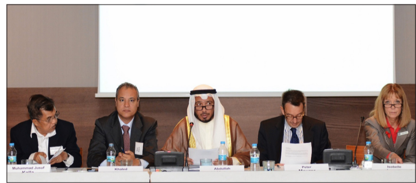
د. عبدالله المعتوق أثناء مؤتمر «ويلتون بارك» في إسطنبول

انقرة: قال المستشار في الديوان الأميري مبعوث السكرتير العام للأمم المتحدة للشؤون الإنسانية د.عبدالله المعتوق أمس إن الصراعات المسلحة والمخاطر الطبيعية غير المستقرة لا تزال تشكل تحديات أمام القطاع الإنساني. وأضاف المستشار المعتوق أمام مؤتمر (ويلتون بارك) المعني بالنهوض بالعمل الإنساني المنعقد حالياً