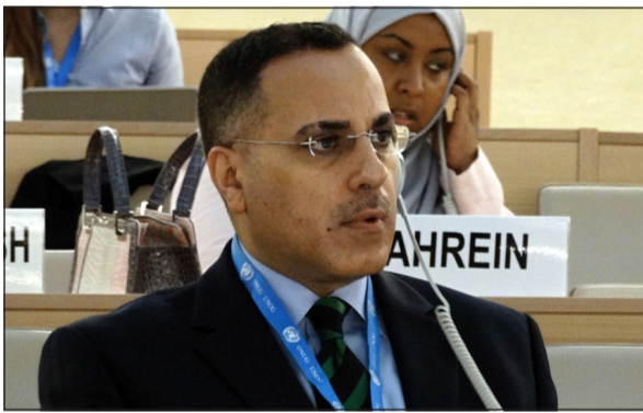
السفير جمال الغنيم خلال الجلسة

عام 2010 ومنها انضمام المملكة للبروتوكولين الاختياريين لاتفاقية حقوق الطفل المتعلقين ببيع الأطفال وبإشراك الأطفال في النزاعات المسلحة وانضمامها في مايو الماضي إلى اتفاقية منظمة العمل الدولية رقم 138 المتعلقة بالحد الأدنى لسن الاستخدام. وأشاد بـ «الإجراءات التي اتخذتها السعودية لتعزيز تعاونها مع المفوضية السامية لحقوق الإنسان حيث تم التوقيع على مذكرة تفاهم بين الطرفين لتعزيز قدرات المختصين في المملكة في مجال القانون الدولي لحقوق الإنسان ولتطوير برامج تدريبية متخصصة في حقوق الإنسان».