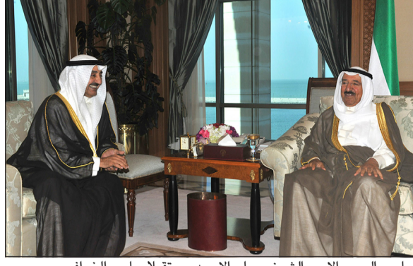
صاحب السمو الأمير الشيخ صباح الأحمد مستقبلاً جاسم الخرافي

وصل مساء أمس الأول وذلك في زيارة رسمية للبلاد. وكان في استقباله وزير الدولة لشؤون مجلس الوزراء ووزير الصحة الشيخ محمد العبدالله ورئيس بعثة الشرف المرافقة محافظ حولي الفريق عبدالله الفارس. وكان السورد روجر جيفورد عمدة مدينة لندن