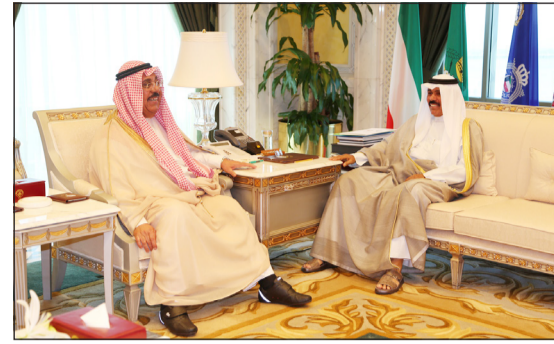
سمو ولي العهد مستقبلاً الشيخ جابر الخالد