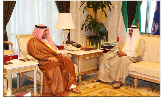
سمو ولي العهد الشيخ نواف الأحمد مستقبلاً الشيخ ثامر العلي

الأحمدي الشيخ د.إبراهيم الدعيج. كما استقبل سمو ولي العهد رئيس جهاز الأمن الوطني الشيخ ثامر العلي.