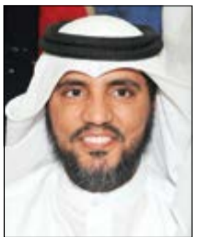
د. حسين قويعان

وعناصر تآزيم بين الحكومة والجلس. وشدد قويعان على أنه سيتم استجواب إلى وزير الصحة في بداية دور الانقضاء إذا استمر الوضع القائم في وزارة الصحة. وفي سؤال وجه إليه هل سيشمل المطالبة بالتعديل ووزير الصحة والإشغال؟ رد قويعان: نعم، لأن هناك نوابا لديهم انتقادات حقيقية وموضوعية تجاه هذين الوزيرين ووزراء آخرين.