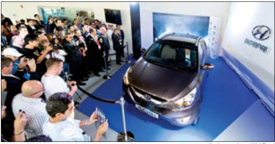
لحظة إطلاق سيارة توسان الجديدة