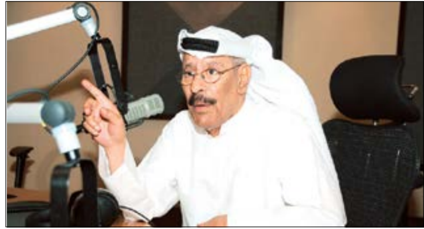
الشاعر الكبير بدر بورسلي

فيني؟.. خفت اللهفة بييعيني.. اسالك.. ما تحس رعشة يديني.. اسالك.. خوفي يا خوفي.. انت تغيرت.. آه لو تدري إذا شفك شيصير.. امشي مدري شلون امشي.. ترتبك مني الخطاوي وما احس بالناس حولي.. وما اشوف الا عيونك.