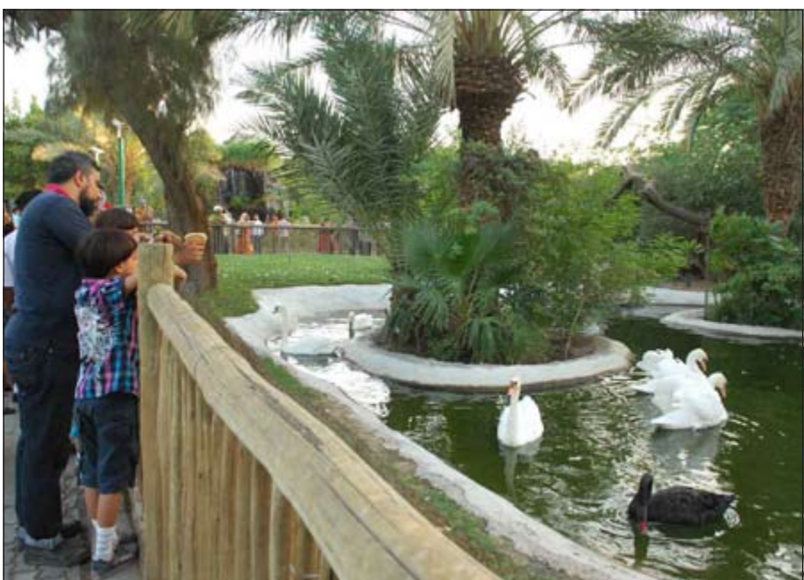
بحيرة البط تحظى بإعجاب الجميع