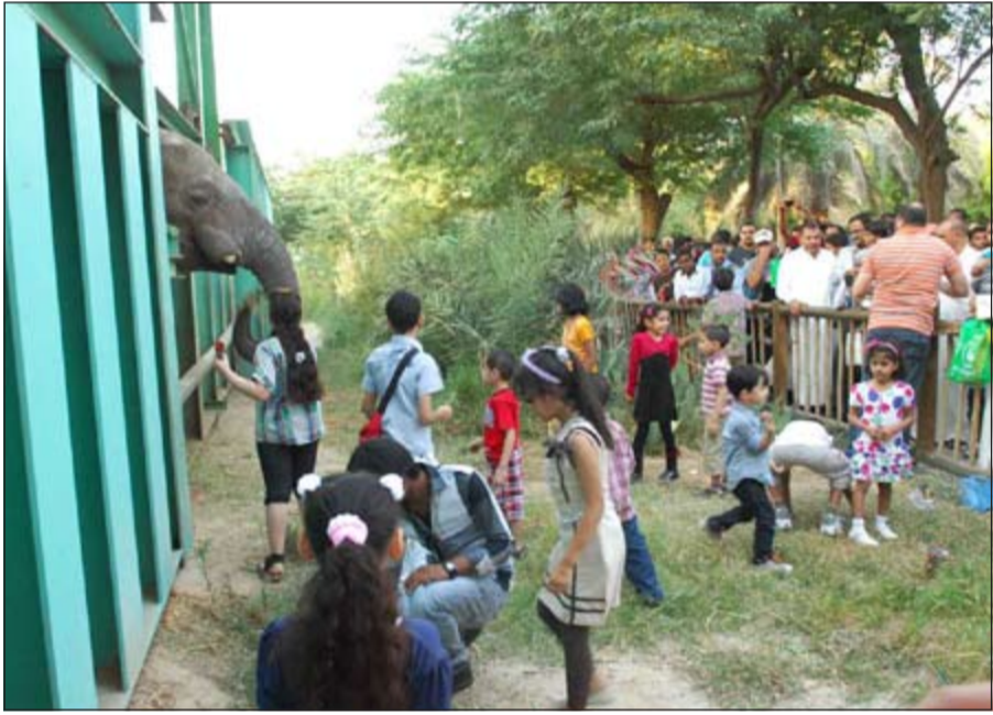
متعة مع مداعبة الفيل