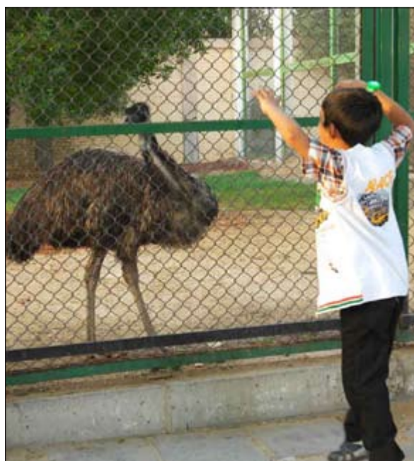
حوار خاص مع النعامة