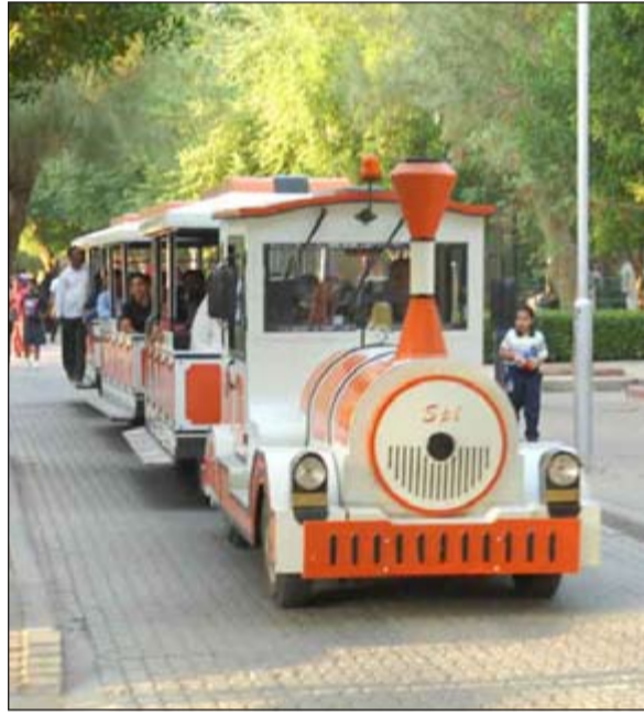
قطار الحديقة يستقطب الكثير من الزوار