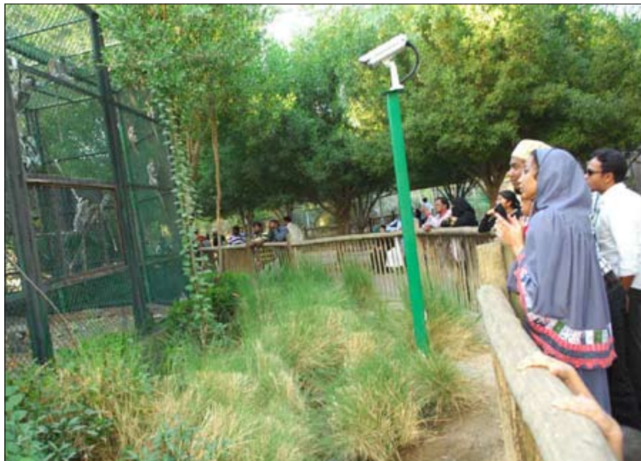
وقفات خاصة أمام أقفاص القرواد

وأما الأطفال فبالإضافة إلى لهوهم ولعبهم في المساحات الخضراء الشاسعة فقد كانت الألعاب المخصصة لهم بانتظارهم، فراحوا يلعبون ويمرحون برفقة أترابهم وأمثالهم في السن بالألعاب المخصصة لأعمارهم والتي كانت الهيئة العامة لشؤون الزراعة والثروة السمكية وفرتها لهم في السابق وأكثر جاذبية على جميع المستويات.