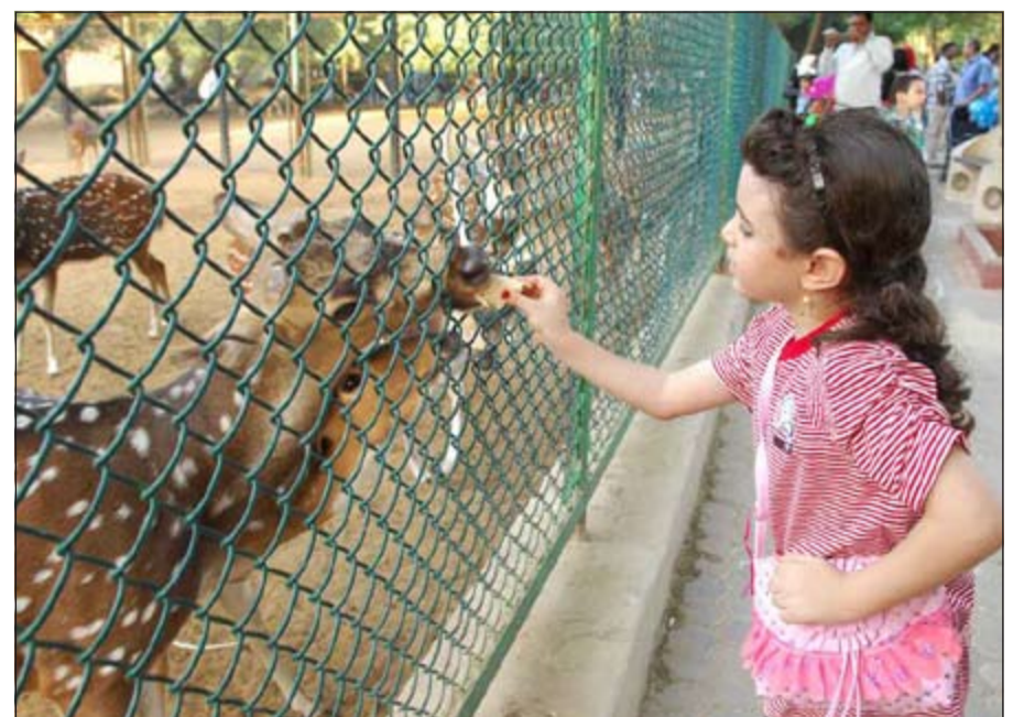
فرحة بإطعام الغزلان