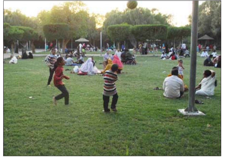
المساحات الخضراء الواسعة داخل الحديقة تستهوي الكبار والصغار

ومن يجلس بناظره مليا ويرصد مستوى الأعمار والجنسيات التي تقصد هذه الحديقة يجد انهم من مختلف الأعمار من المواطنين والمقيمين من مختلف الجنسيات إضافة إلى بعض الزوار من خارج الكويت الذين حضروا خصيصا لزيارة أقربائهم والاستمتاع بزيارة الحديقة التي شهدت تطورات كبيرة حصلت أخيرا على مرافقها والخدمات العامة المقدمة فيها، والتي يتوقع أن تحقق طفرة في عدد الزوار خلال العام الجاري والعام الماضي، وخصوصا في ظل انتشار المطاعم المختلفة وتزويد الحديقة بألعاب مميزة للأطفال وزيادة المساحات الخضراء وتخليدها.