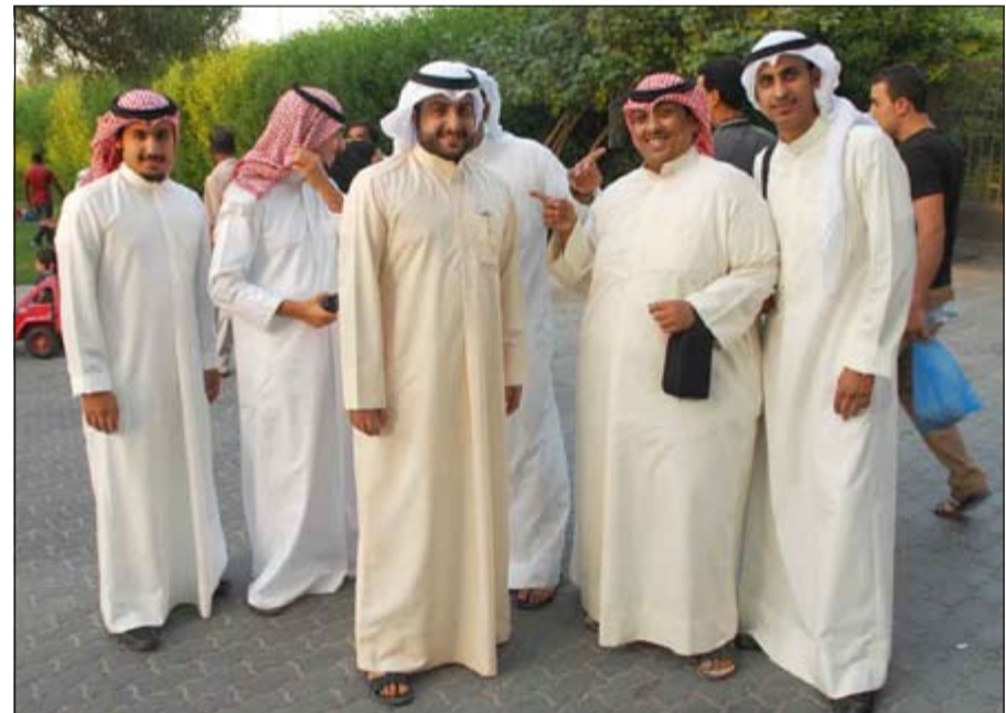
مجموعة من الشباب خلال نزهة في الحديقة

مع إشراقة فجر عيد الأضحى المبارك وبعد أداء صلاة العيد انطلق المواطنون والمقيمون، فأحيا شعائر الله بديح الأضاحي وتوزيعها على الفقراء والمساكين والأهل والأصحاب، في حين يحضر الأبناء للاحتفال بالعيد المبارك من خلال لبس الجديد وجدولة المواعيد للانطلاق في الزيارات وصلة الأرحام وارتياح الأماكن الترفيهية والمعالم المميزة. ومن هذه الأماكن والمعالم المميزة التي يحرص الجميع على ارتيادها في كل عيد ومناسبة وتكون على قائمة أولوياتهم حديقة الحيوان التي تشهد في كل عيد حضورا مذهلا، حيث تحضر الأسر برفقة أبنائها لقضاء أوقات رائعة وخصوصا في هذه الأيام الخريفية ذات النسمات العليلية التي تدخل البهجة للنفوس وتسمح بالجلوس في المساحات الكبيرة التي تحتوي عليها حديقة الحيوان في منطقة العمرية.