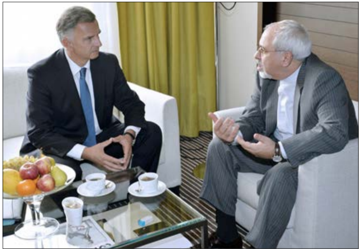
وزير الخارجية الإيراني خلال اجتماعه بنظيره السويسري على هامش المحادثات النووية في جنيف أمس

وقال إنه يعاني أيضا من مشاكل صحية أخرى غير معروفة ومع وصوله إلى الولايات المتحدة أصبح الليبي خاضعا لقوانين النظام القضائي الأميركي وهو ما يعني أنه لم يعد ممكنا استجوابه دون إبلاغه بحقه الدستوري