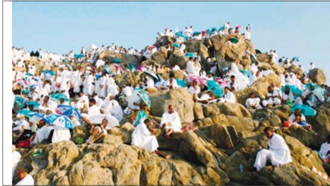
حجاج بيت الله فوق جبل عرفات