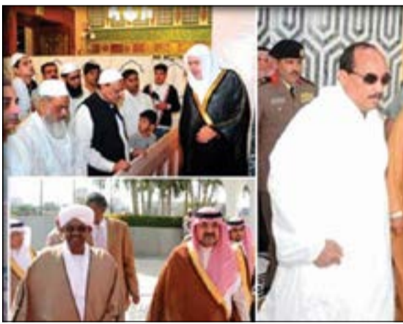
الرؤساء الموريتاني والباكستاني والسوداني