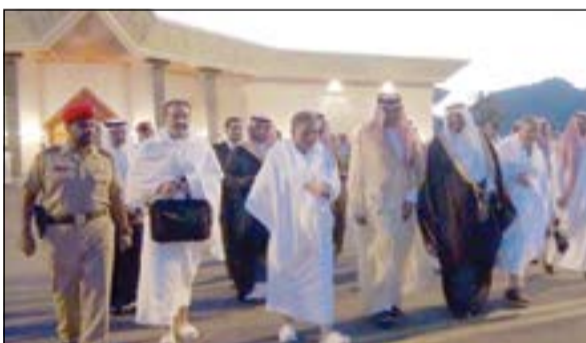
الرئيس التركي عبدالله غول يغادر ميفات ذي الحليفة متوجها إلى مكة المكرمة

وصل إلى المملكة بغية تأدية مناسك الحج هذا العام 4 من رؤساء الدول، هم الباكستاني ممنون حسين والموريتاني محمد ولد عبدالعزيز والسوداني عمر البشير والتركي عبدالله غول.