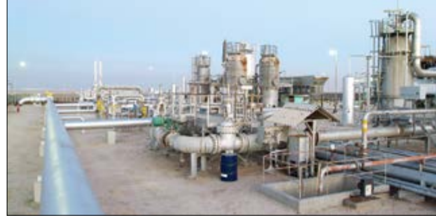
مشاريع ضخمة لشركة نفط الكويت

بقيمة 23 مليون دينار أكبرها مع بقيمة 7,8 ملايين دينار مع شركة فينسيكو العالمية لتقديم خدمات الدهان والطلاء لخزانات وصهاريج تابعة للشركة، فيما جاء ثاني أكبر العقود بقيمة 6,9 ملايين دينار مع شركة جامبو للسياحة والسفر لتقديم خدمات السفر والرحلات إلى موظفي الشركة. ووقعت الشركة خلال شهر يوليو 20 عقداً بقيمة 79,8 مليون دينار كان أكبرها 3 عقود بقيمة 10,1 ملايين دينار لكل عقد وتم منحها لتنفيذ عمليات الصيانة والخدمات