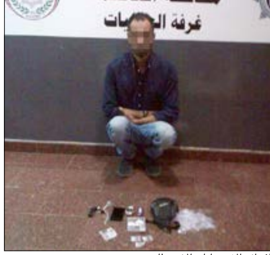
الایرانی المزور وامامه المضبوطات