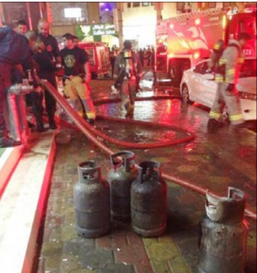
سلندرات الغاز كادت ان تحدث انفجارات وتزيد من قوة الحريق

ناشد مدير ادارة العلاقات العامة والإعلام في الإدارة العامة للإطفاء العقيد خليل الأمير أرباب الأسر توكي الحنطة والحنز في أيام عيد الأضحى المبارك وخصوصا في المنازل من خلال اعداد وجبات الطعام والاستعداد للعيد وعدم ترك الأواني من غير رقيب وإغلاق صمامات الغاز بعد الانتهاء من الطهي مباشرة وإغلاق شفاطات التهوية بعد الانتهاء من الطبخ، من جانبه أوصى الأمير أولياء الأمور بمتابعة أطفالهم وإبعاد جميع مصادر الاشتعال عنهم مثل الكبريت والولاعات حتى لا يتم العبث بها وعدم إشعال الألعاب النارية الا بمتابعة منهم وتكون في أماكن آمنة وبعيدة عن المناطق السكنية والمركبات حتى لا تتعرض هذه المناسبات السعيدة الى مأساة، كما ناشد الأمير مرتادي البحر والشاليهات إغلاق مصادر الكهرباء في المنزل قبل المغادرة وإغلاق صمامات