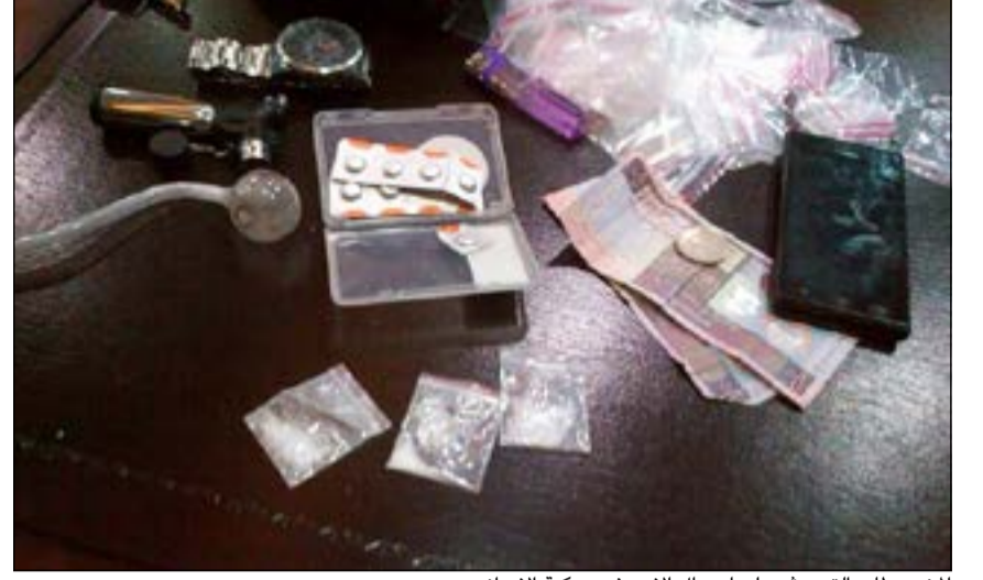
المضبوطات التي عثر عليها رجال الامن في مركبة الإيراني

الطلب من قائدها التوقف رفض الامتثال وحاول الهرب فتم طلب اسناد واجباره على التوقف على مقربة من منطقة الشعب، وأشار المصدر الى ان رجال الأمن اكتشفوا ان المركبة التي بحوزته مطلوبة لقضية تزوير وان المتهم استأجر