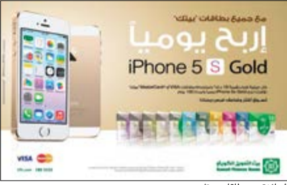
الجائزة مع بطاقات بيتك