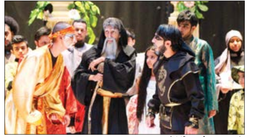
مشهد من مسرحية «حرب النينجا»

يبسود أن النجاح الكبير الذي حققته عروض المسرحية الاستعراضية الهادفة «حرب النينجا» في عيد الفطر الفائت أشعل الحماسة في أعضاء جروب «كويت سين» الجهة المنتجة للمسرحية وقرروا إعادة تقديمها من جديد طوال أيام عيد الأضحى المبارك وذلك على خشبة مسرح مركز الكويت للتوحد غرب مشرف، وبدأ قبل فترة مخرج المسرحية عثمان الصفي وفريق عمله بتكثيف بروفات الحركة والإشتغال على التدريبات والاستعراضات الغنائية، خاصة بعد أن قام مؤلفها عثمان الشطي بتعديل النص الرئيسي بشكل مبسط، دافعا إلى المزيد من الإثارة والتشويق. وتحمل المسرحية - التي يشارك فيها مجموعة من الفنانين الأصحاء بشاركتهم إخوانهم من أبناء فئة ذوي الاحتياجات الخاصة ومتلازمة داوون - رسالة إنسانية هادئة يأتي في مقدمتها إصرار فريق «كويت سين» على تقديم عرض مسرحي احترافي راق يسعد كافة أفراد الأسرة، لاسيما عندما يتم