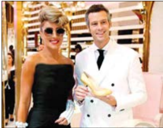
إهداء مايا دياب الحذاء الذهبي