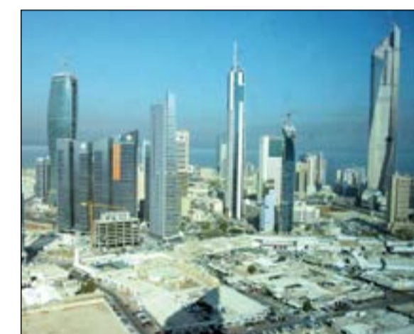
ارتفاع التداول على العقارات الخاصة والاستثمارية

العقار الخاص و13 عقارا في العقار الاستثماري، أما على مستوى الوكالات العقارية فقد تحلقت المحافظة بتداول 4 عقارات في العقار الخاص خلال هذه الفترة. حوالي في المركز الثاني واحتلت المرتبة الثانية من بين المحافظات من حيث التداولات العقارية من خلال تداول 39 عقارا تداول منها 28 عقارا في العقار الخاص و10 عقارات في العقار الاستثماري وعلى مستوى الوكالات العقارية حظيت المحافظة بتداول عقار واحد في العقار الاستثماري خلال تلك الفترة. مبارك الكبير ثلثا وجاءت محافظة مبارك الكبير في المرتبة الثالثة في التداولات العقارية بواقع 31 عقارا تداول منها 30 عقارا في العقار الخاص وعقار واحد في العقار الحرفي وعلى مستوى الوكالات العقارية لم تحظ المحافظة بأي تداولات عقارية خلال هذا الأسبوع. الفروائية رابعا وجاءت محافظة الفروائية في المرتبة الرابعة وذلك من خلال تداول 20 عقارا تداول منها 12 عقارا في العقار الخاص و8 عقارات في العقار الاستثماري وفي الوكالات العقارية لم تحظ المحافظة بتداولات عقارية خلال تلك الفترة. العاصمة خامسا وجاءت محافظة العاصمة في الترتيب الخامس من خلال تداول 14 عقارا تداول منها 11 عقارا في العقار الخاص و3 عقارات في العقار الاستثماري وعن الوكالات العقارية لم تحظ المحافظة بتداولات عقارية تلك الفترة. الجبراء سادسا وفي المرتبة السادسة جاءت محافظة الجبراء من خلال تداول 10 عقارات في العقار الخاص وفي الوكالات العقارية لم تحظ المحافظة بأي تداولات عقارية خلال هذه الفترة. عاطف رمضان