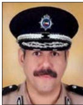
اللواء الشيخ فيصل النواف

تشكل أضرارا بالغة بالمصالح الاقتصادية والتجارية العامة والخاصة والاستيلاء على أموال الغير بدون وجه حق ودون منفعة تذكر. تصريحات النواف جاءت عقب تنامي ظاهرة عمليات النصب والاحتيال التي يلجأ إليها العديد من الشركات الوهمية والأشخاص الذين دأبوا في الآونة الأخيرة على نشر إعلانات ورسائل قصيرة عبر مواقع التواصل الاجتماعي