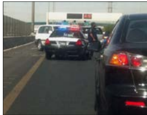
الحادث احدث شللاً مروريا في الطريق إلى ميناء الشويخ

تسبب حادث تصادم ثلاثي في شل حركة السير على طريق ميناء الشويخ ظهر اول من امس من دون ان تلحق إصابات بقائدي المركبات الثلاث. وقال مصدر امثني ان بلاغا ورد من قائدي الطريق المؤدي الى ميناء الشويخ عن وقوع حادث تصادم، ليهرع على الفور رجال المرور، وتم سحب المركبات من قبل ونش الداخلية، حيث حضر رجال الطوارئ الطبية وقام بالكشف على قائدي السيارات وتقديم العلاج اللازم. وأفاد المصدر بان حالات الصابين كانت طفيفة ولم يتم نقلهم الى المستشفى، وتم تخطيط موقع الاصطدام وإحالة الى الخبير الفني لمعرفة من المتسبب.