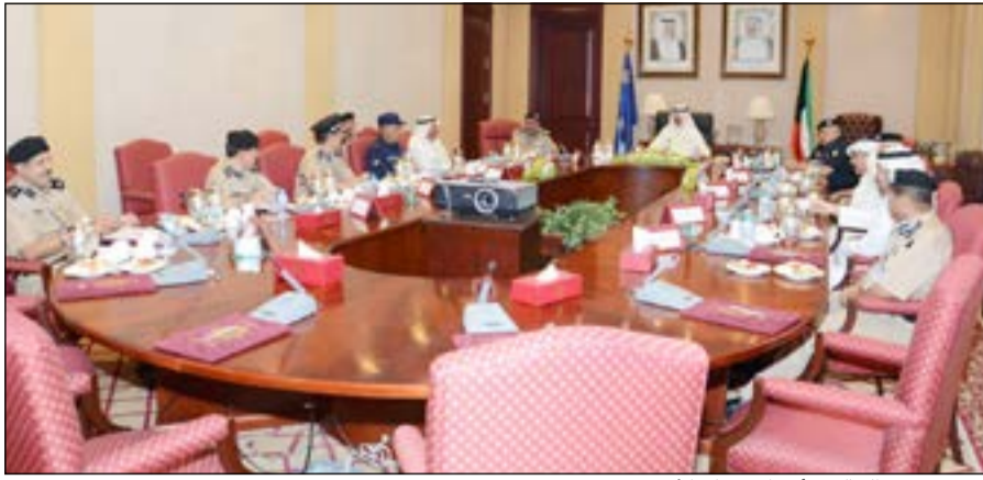
الشيخ محمد الخالد ترأس الاجتماع الأمني

ضباط بحروح وكسور وكدمات منفرقة أثناء التدريب الميداني. وقالت ادارة الاعلام الأمني في الوزارة في بيان صحافي ان هذه المعلومات غير دقيقة، مبينة ان الاصابات كانت لطالبيين ضابطان وليست لثلاثة ضباط كما تم تداوله، حيث عولجا في المستشفى وعادا الى التدريب مرة اخرى.