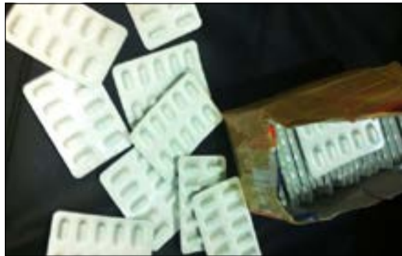
الحبوب المخدرة ضبطت في امثلة البنغالي

الجمركية عقب وصوله من موطنه وتم تفتيش أمتعته لبعثر بحوزته على الحبوب، ولم تمر دقائق على واقعة ضبط البنغالي حتى وصلت طائرة قادمة من أديس أبابا حتى اشتبهت ذات المفتشة الجمركية في واقعة، حيث لاحظت على الوافدة علامات الارتباك لتقودها الى غرفة التفتيش الذاتي وتعثر بين أمتعته على كيس به مادة القات الممنوع دخولها وتداولها في الكويت.