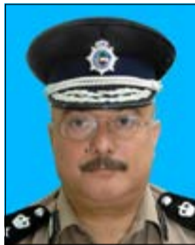
العديد شباب الشمري

قد اعتمدت على متابعة جميع المهام الأمنية المعتمدة لعموم الأجهزة الأمنية والتركيب على مغادرة ووصول حجاج بيت الله الحرام إلى البلاد والتفتيش على جميع المنافذ الجوية والبحرية والحرية ومراكز الحدود والمخافير ومتابعة تواجد رجال الأمن خلال احتفالات وفعاليات عيد الأضحى المبارك والعمل على رفع تقارير في حال وجود أي