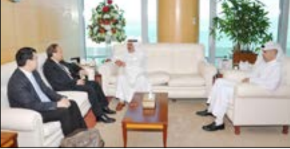
الشمالي مستقبلا السفير الفيتنامي

العامية وسبل تعزيز العلاقات بين البلدين في مجال الصناعة النفطية.