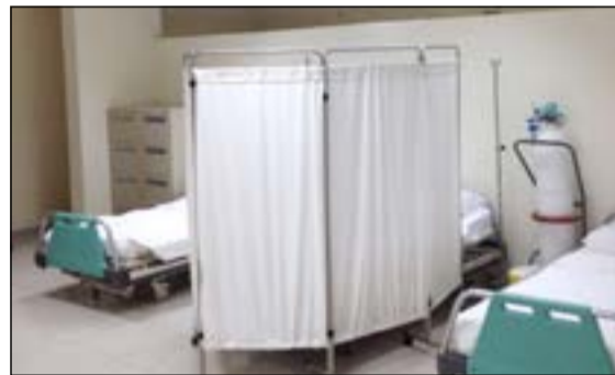
عيادات الفريق الطبي