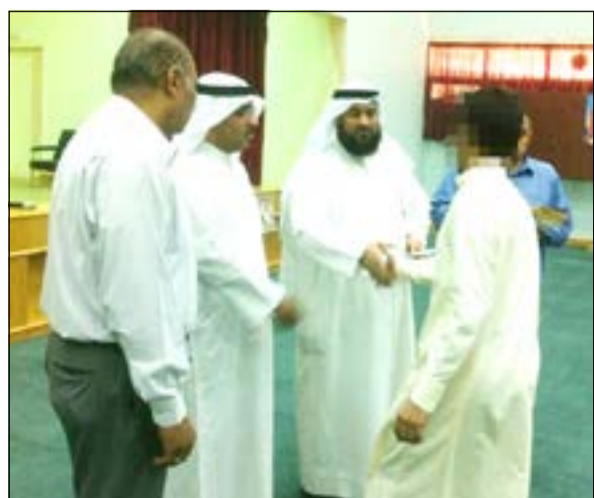
توزيع العيادي على نزلاء دار الرعاية