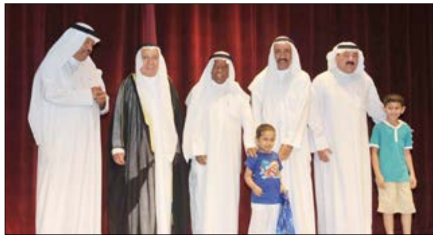
هدايا للأطفال المرضى