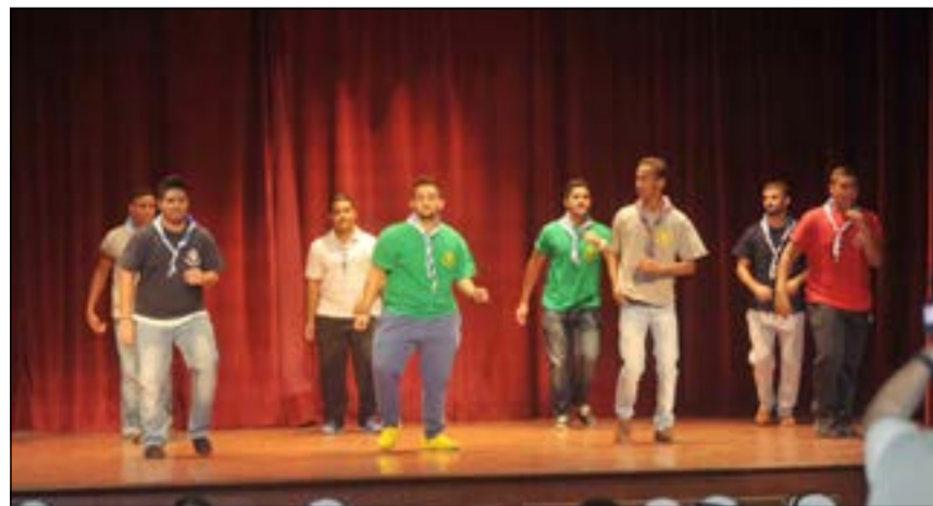
لوحة استعراضية قدمها فريق الكشافة

تحت هذا المشروع لخدمة أطفال المرضى نشكر الجهات الداعمة للمشروع وهي: شركات على الغانم وأولاده والبابطين للإلكترونيات وعيسى حسين اليوسفي وأولاده وجمعية العبدان والقصور التعاونية ومدرسة الكويت الإنجليزية وإذا كان هناك من كلمة شكر في حقم فلكم الجزء والثواب من الله تعالى على دعمكم لأبنائكم المرضى والشكر لأولياء الأمور.