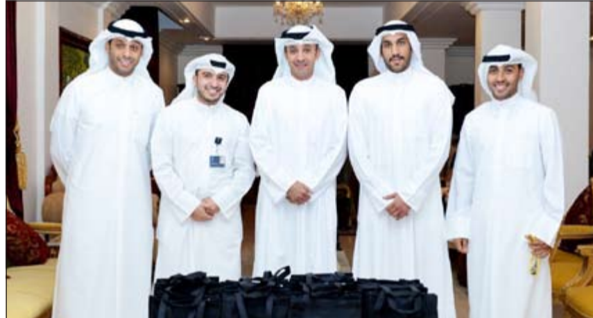
صورة تذكارية لموظفي الشركة الذين قاموا بتوزيع مستلزمات الحج