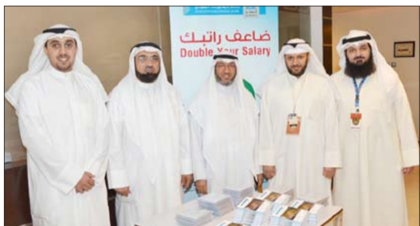
جانب من جولة موظفي العلاقات العامة بالبنك