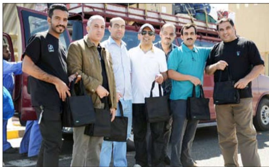
الحجاج محتفظون بمستلزمات «زين»

أعلنت شركة زين أكبر شبكة اتصالات متطورة في الكويت، أنها قامت بتوزيع مستلزمات الحج في بادرته السنوية على حجاج بيت الله الحرام لهذا العام، وذلك على أكثر من 40 حملة معتمدة رسمياً من قبل وزارة الأوقاف والشؤون الإسلامية وعلى الحجاج المتوجهين للأراضي المقدسة عن طريق منفذ السالمي البري. وكرت الشركة في بيان صحفي أن هذه المبادرة جاءت من منطلق حرصها على مشاركة الحجاج المشاعر الإيمانية التي تسيطر على هذه اللحظات، حيث أنها قامت بتوزيع المستلزمات الأساسية عليهم لتخفف عنهم بعض العناء خلال أدائهم مناسك الحج، مبيئة أنها حرصت أيضاً على أن تكون على مقربة باستمرار من زوار بيت الله الحرام كل عام. وأكدت زين أن هذه المبادرة وبما تحمله من مساهمات تجاه الحجيج جاءت لترسخ مدى الاهتمام الكبير الذي توليه بفعاليات موسم الحج كل عام، والذي دأبت من خلاله على تقديم العديد من المبادرات والعروض التي كان لها الدور الكبير