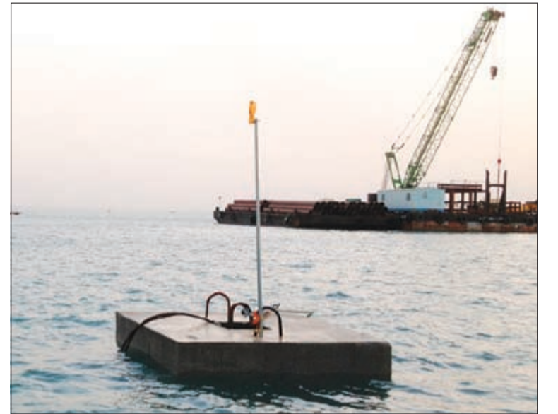
الحدى القواعد الخرسانية في منطقة ميناء الشويخ