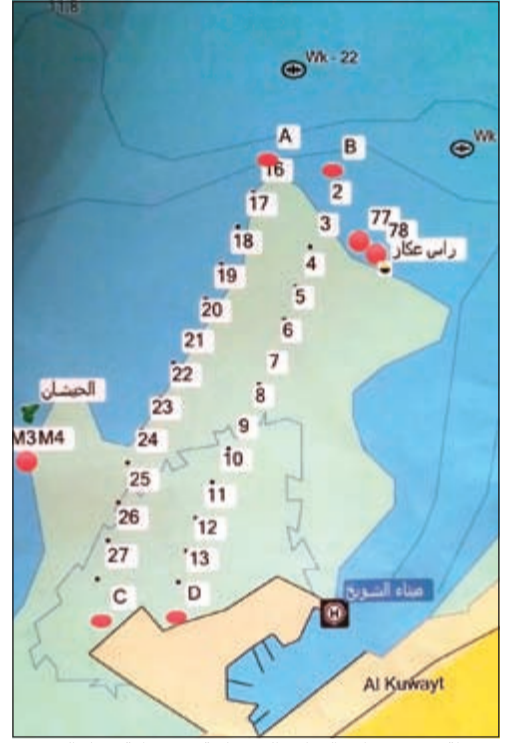
خريطة توضح مواقع القواعد الخرسانية في منطقة ميناء الشويخ

دعت وزارة المواصلات مرتادي البحر من المواطنين والمقيمين الى توخي الحيطة والحذر