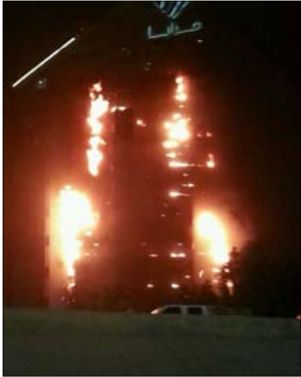
النيران وقد امتدت لتشمل كامل البناية