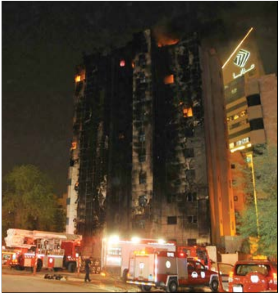
سيارات الإطفاء أمام البناية قبيل السيطرة الكاملة على الحريق

5 مراكز إطفاء أخرى هي السالمية الجنوبي ومشرف والعارضية والإنقاذ الفني والإستاد. ولفت العقيد الأمير الى ان التحقيقات الأولية تشير الى ان بداية الحريق كانت في الطابق الخامس من المبنى وبعدها امتدت النيران لتأتي على بقية الطوابق الأخرى. وأكد ان وحدة التحقيق ستبدأ فوراً في العمل على تحديد أسباب اندلاع الحريق، مشيراً الى ان رجال الإطفاء سيطروا بشكل شبه كامل على الحريق بحلول الساعة العاشرة مساءً، ثم بدأوا في تمشيط طوابق المبنى للتأكد من عدم وجود أي مصابين أو وفيات. هذا، وتواجد في موقع الحريق مدير عام الإدارة العامة للإطفاء اللواء يوسف الأنصاري ونائبه المدير العام لشؤون مكافحة العميد خالد المكراد.