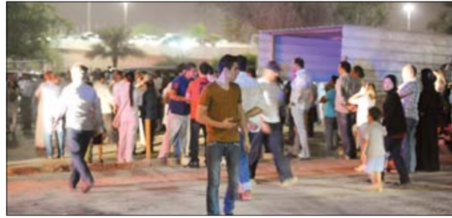
حشد من الناس يتابع عمل الإطفاء في موقع الحريق