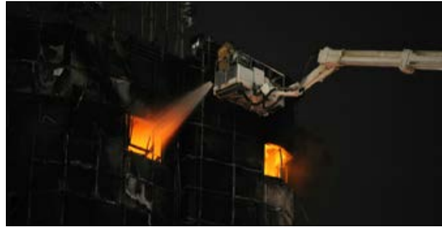
أحد رجال الإطفاء يحاول إخماد النيران