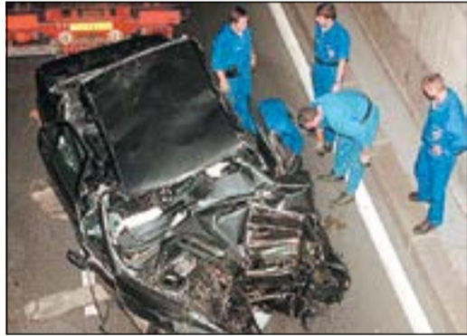
مصراع ديانا ودودي