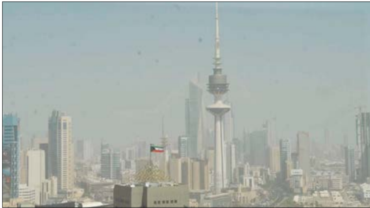
جو غير مستقر وغبار امس