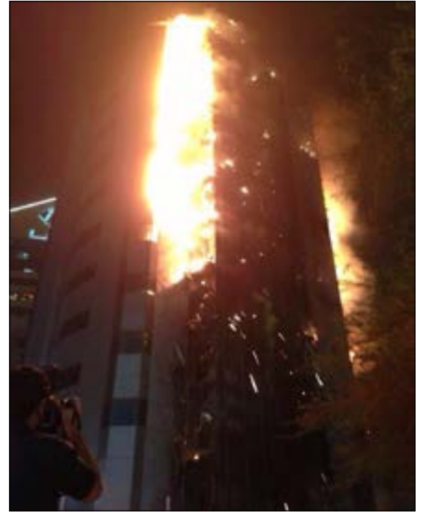
أسنة النيران تتصاعد من الطوابق العليا للمباني

لا إصابات أو وفيات والخسائر «مادية جسيمة»