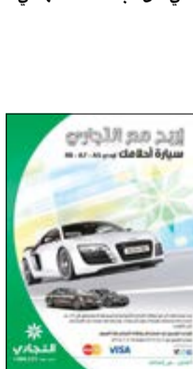
سيارة أودي A7 ضمن حملة «أربح مع التجاري سيارة أحلامك»

أجرى البنك التجاري الكويتي السحب الثاني على سيارة أودي A7 ضمن حملة «أربح مع التجاري سيارة أحلامك» الموجهة لحاملي البطاقات الائتمانية والبطاقات المسبقة الدفع والتي تتضمن 3 رايحين طوال فترة الحملة التي كان البنك قد أطلقها في 2