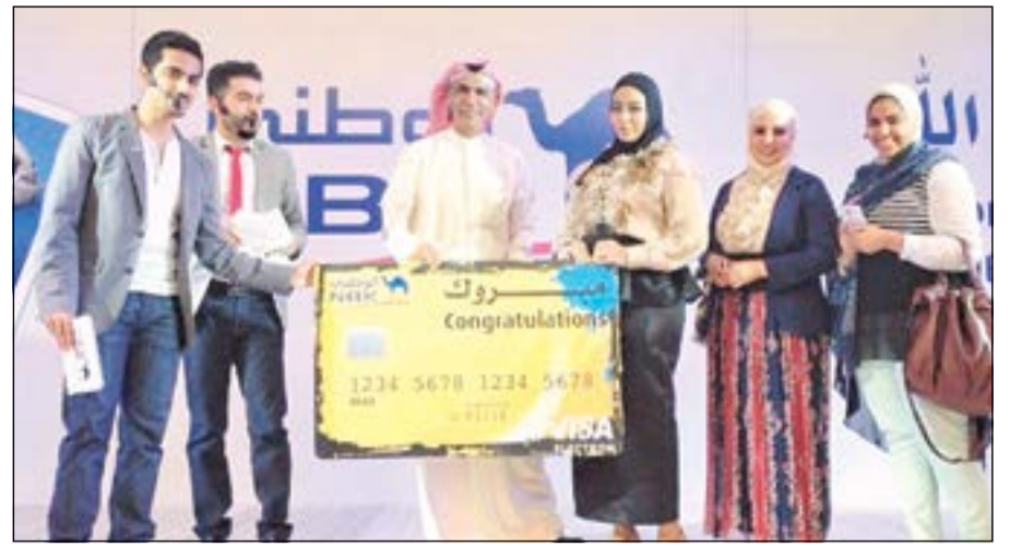
الناصرة تتسلم شيك الجائزة