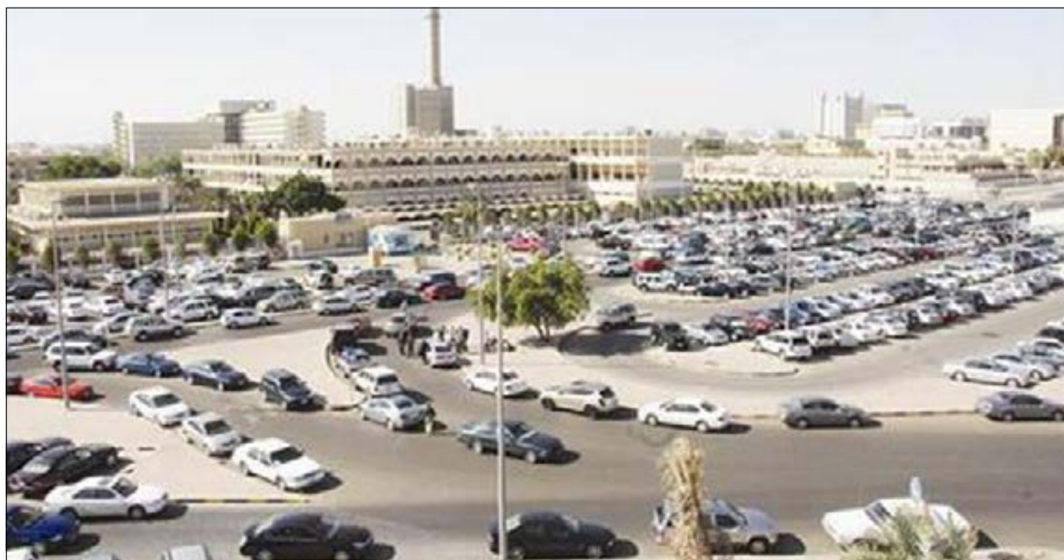
رواد ديوانية الغيص تحدثوا عن مشاكل كثيرة تعاني منها منطقة كيفان