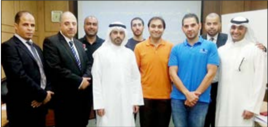
جانب من تكريم موظفي «المتحد» الحاصلين على شهادة الخدمات المالية الإسلامية

حقق موظفو البنك الأهلي المتحد المراكز الأولى في برنامج شهادة الخدمات المالية الإسلامية بين جميع المشاركين في هذا البرنامج الذي انعقد تحت رعاية معهد الدراسات المصرفية، وباعتماد هيئة مهنية دولية هي المجلس العام للمؤسسات والبنوك الإسلامية ومقرها البحرين، حيث حصل سبعة من موظفي البنك الأهلي المتحد، يمثلون إدارات مختلفة في البنك على هذه الشهادة بتفوق إستحق الإشادة والتكريم من إدارة البنك. تناولت شهادة الخدمات المالية الإسلامية دراسة العديد من البرامج المهمة، على مدار ستة أشهر متوالية ومجموعة من الاختبارات وأوراق البحث، والأسس الاقتصادية والشرعية الإسلامية للخدمات المالية الإسلامية، والمعايير الشرعية الدولية، وآليات الرقابة الشرعية، وأسس الهندسة المالية لعمليات المؤسسات المالية الإسلامية.