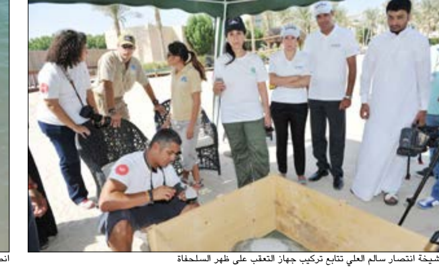
الشيخة انتصار سالم العلي تتابع تركيب جهاز التعقب على ظهر السلحفاة

ولفت إلى أن المشروع هذا يتم بشكل متكامل ما بين الجمعية ومنظمة البحث الأحيائي وجامعة أكسترد وبعض الجهات المحلية المهتمة بالحفاظ على البيئة البحرية. ويذكر، تحدث مدير عام فندق الجميرة مارك غريفث مشيراً إلى أنه أول عمل بيئي ينظمه الفندق وينبع ذلك من اهتمامه الدائم بالمشاريع البيئية الخاصة بالبيئة البحرية، معرباً عن شرفه باستضافة هذا الحدث المحلي المهم والذي يهدف لحماية الحياة الفطرية والتنوع الأحيائي. ووجه الدعوة لكل المهتمين باطلاق اي نوع من هذه السلاحف او غيرها بان شاطئ