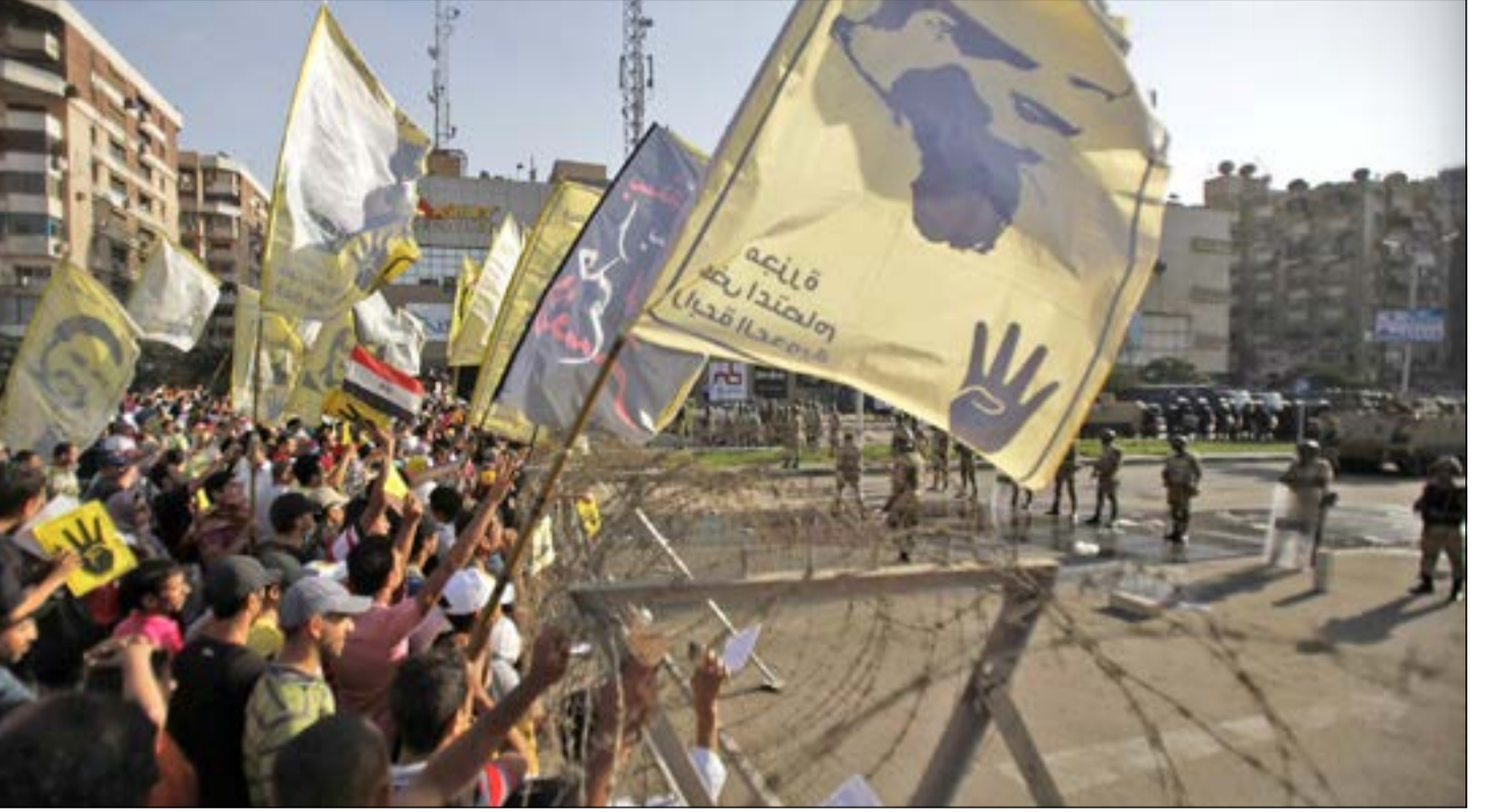
انتصار الرئيس المعزول د.محمد مرسي خلال تظاهراتهم أمس الأول الجمعة أمام الأسلاك الشائكة في رابعة العدوية