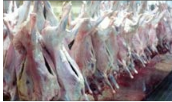
جانب من مشروع الأضاحي