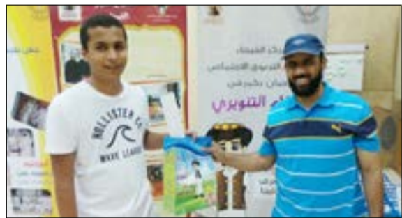
توزيع الجوائز على المشاركين