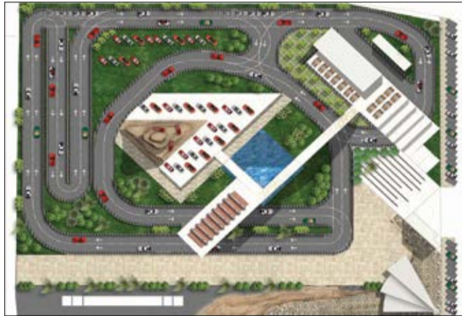
يكشف متحف السيارات

قريبا عن أحدث إنجازاته وهي «حلبة متحف السيارات» التي تم بناؤها لتكون أحدث إضافة لمرفق المتحف.