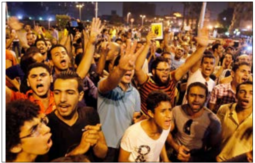
أنصار الرئيس المعزول محمد مرسي يتظاهرون في ميدان التحرير في الأول من أكتوبر (رويترز)

ودفعت قوات الجيش والشرطة بعدد كبير من القوات المشتركة للسيطرة على الاشتباكات، وبالفعل نجحت في وقف الاشتباكات، بينما انتشرت الأليات العسكرية في أغلب الميادين بالمحافظة.