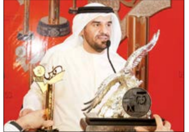
الجسمي بعد تكريمه

منح مهرجان فرسان الجودة لعام 2013، «السفير فوق العادة للنوايا الحسنة» الفنان الإماراتي حسين الجسمي، تكريما لاستثنائيا خاص في الدورة الحادية عشرة، بدرع «أم الدنيا» بعد إجماع جميع أعضاء لجنة التحكيم عن مجمل أعماله الفنية ونشاطاته الغنائية التي تركت أثرا واضحا في الجمهور في مصر والخليج والعالم العربي، الى جانب مشاركته الإيجابية مع الشعب المصري من خلال أغنية «تسلم ايديك» التي حققت نجاحا وانتشارا كبيرا في جمهورية مصر العربية، وعلى أثرها قررت إدارة مهرجان الجودة منحه هذا التكريم، الى جانب «درع فارس الجودة عن فئة الغناء العربي»