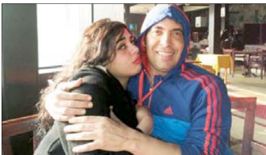
صورة تجمع سعد الصغير والراقصة شمس

بعد الاخبار التي نشرت في وسائل الإعلام المختلفة، حول زواج المطرب الشعبي سعد الصغير من الراقصة شمس، خرج الصغير عن صمته، وعبر عن «استيائه» من هذه الشائعات والمستندات المزورة لعقد زواجه، نافيا زواجه من شمس التي نشرت صورة عقد بشير إلى زوجها أخيرا، وأكد أنه لم يتزوج على زوجته وأم أولاده. وقال سعد: إن شمس كاذبة في كل ما تقوله وان العقد الذي نشرت صورته مفبرك، وأشار إلى أن الصور التي نشرت لهم معا كان في فيلم «ولاد البلد»