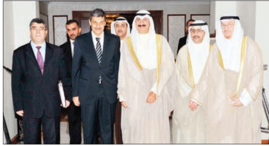
لقطة جماعية للشيخ سالم العبد العزيز ووزير مالية الجزائر كريم جودي والوفد المرافق