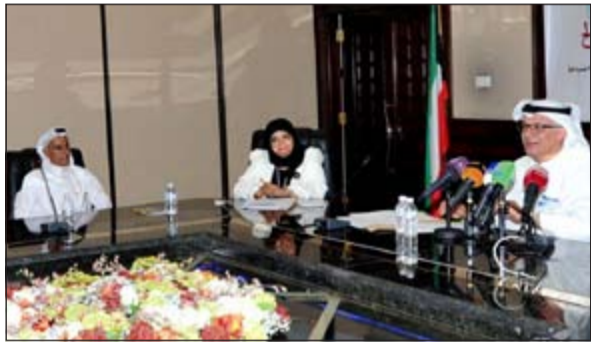
جانب من المؤتمر الصحافي

جاء تصريح الصبيح على هامش احتفال الجائزة للمصانع المتميزة ودوة الفرص الاستثمارية قطاع البتروكيماويات بالتعاون مع منظمة الخليج للاستشارات الصناعية. وأشار الصبيح الى ان برنامج الجائزة يسعى الى تشجيع الشركات في القطاع الصناعي على قياس اداؤها الحالي ومقارنته بافضل الممارسات العالمية ومساعدة وتقدير الشركات في القطاع الصناعي التي وصلت او تعمل جاهدة لتحقيق افضل الممارسات العالمية، مشيرا الى ان حرص الهيئة ممثلة بفريق العمل المشرف على برنامج الجائزة على الاستفادة من دوراتها السابقة وتطويره بما