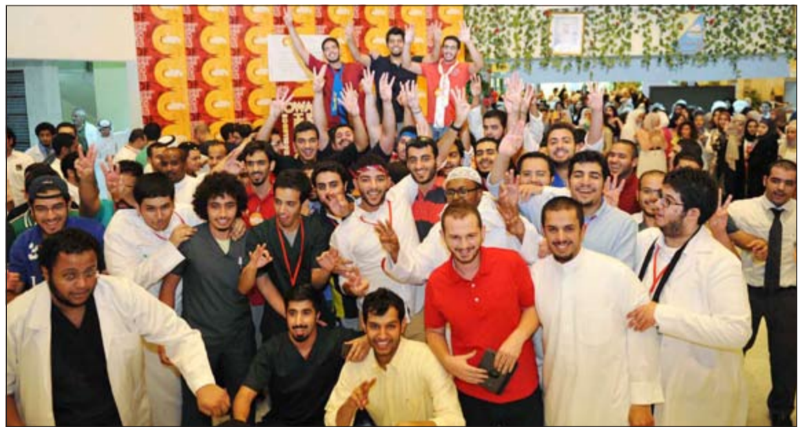
انصار القائمة الطبية يحتفلون بالفوز