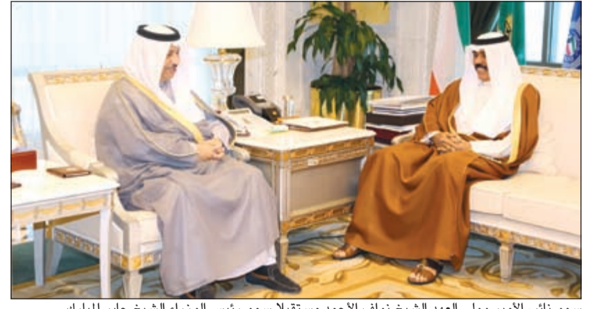
سمو نائب الامير وولي العهد الشيخ نواف الاحمد مستقبلا سمو رئيس الوزراء الشيخ جابر المبارك