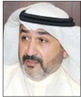
د. أحمد الشطي

ونحن نناقش مع بعض التجار أنه غير مرتبط بسلعة واحدة ولديه مجموعة من السلع، ويجب على التاجر أن يتحمل ولا يجوز أن يزيد التاجر سعر السلعة في وقت الأزمة ويتخذ أسعار الزيادة بعد انتهاء الأزمة ولا توجد خطوات من وزارة التجارة تجاه ذلك في بعض الأحيان.