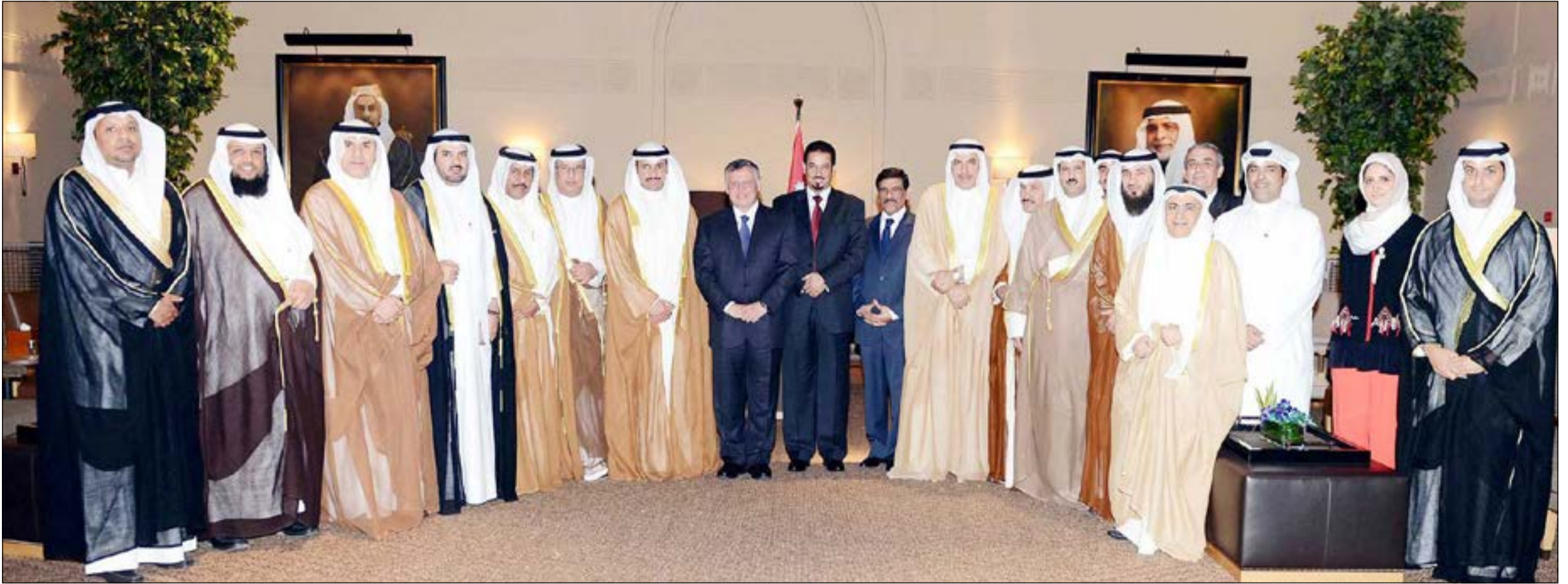
ملك الأردن عبدالله الثاني متوسلاً رئيس مجلس الأمة مرزوق الغانم والوفد النيابي المرافق بحضور السفير د.محمد الدعيح

ثمن الموقف القومي للمملكة الهاشمية بفتح حدودها وملاجئها للأشقاء السوريين