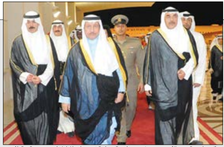
ممثل صاحب السمو الأمير سمو رئيس مجلس الوزراء الشيخ جابر المبارك لدى عودته إلى البلاد

ممثل الأمير عاد إلى البلاد: مشاركة الكويت في اجتماعات الأمم المتحدة عززت مكانتها الدولية 02