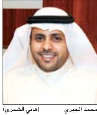
محمد الجبري (ماني الشمري)

أكد خلال لقاء «أبو الأبناء» أن حل قضية صندوق الأسرة وتعديلات اللائحة التنفيذية يؤكد مدى تعاون الحكومة محمد الجبري: قانون مكافأة المتقاعدين سيحظى باهتمام بالغ في دور الانعقاد المقبل وسنحرص على إعطاء العسكريين حقوقهم سأتابع تامين بيوت التركيب في 6 مناطق بالبلاد بعد أن أصبحت غير صالحة للسكن التنمية البشرية هي أساس النهوض في المجتمع وعلى الحكومة الاستثمار في الإجراءات التصحيحية حل القضية الإسكانية هم كل بيت كويتي وسنسعى لتشكيل لجنة برلمانية لإيجاد توافق نيابي - حكومي لإنهائها في أسرع وقت يد التعاون ممدودة لجميع الوزراء متى ما كان الإنجاز والعمل عنواننا لهم الوضع الصحي تركة ثقيلة وعلى الوزير المختص الدفع باتجاه معالجة الأمور بشكل سريع 24 25