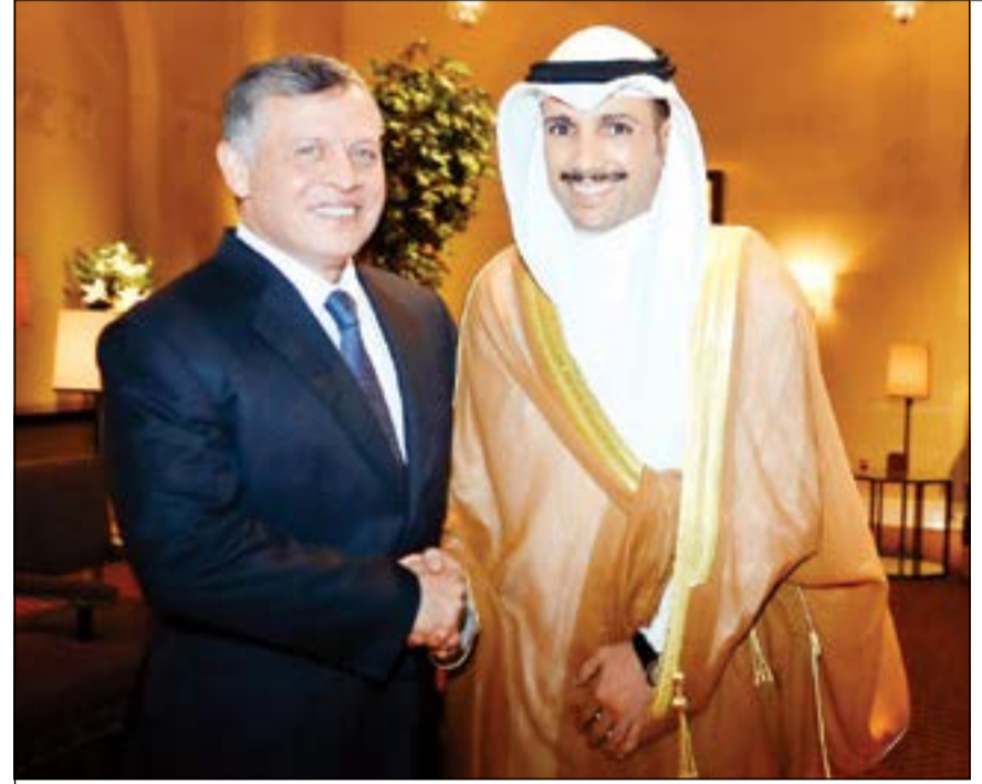
الملك عبدالله الثاني خلال استقباله رئيس مجلس الأمة مرزوق الغانم

ومواعيد تقييمهم - والآثار المترتبة على هذا التقييم - جميعها مرتبطة بالكفاءة في أجزائها متطلبات الوظيفة والحالة الصحية والقدرة على مواصلة العمل والإنتاج والتعاون والتنسيق لصالح إنجاز العمل. وأضافت المصادر ان التعديلات الجديدة تهدف الى اقرار ضوابط معلنة - وهذه تتم لأول مرة - بهدف المحافظة على الكوادر ذات الكفاءة النوعية والالتزام بالشفافية من خلال تطبيق معايير موضوعية على الجميع. وأشارت المصادر الى ان هذه الخطوة تتزامن مع اقرار شروط جديدة لشغل الوظائف القيادية وضوابط التجديد أو عدم التجديد للقياديين إضافة إلى بعض الأحكام الخاصة بالتعيين واختيار القياديين والحد الأقصى لمدة التجديد، وقد تضمنت التعديلات أن تنشأ لجنة تتبع مجلس الخدمة المدنية تتولى النظر وإبداء الرأي في الترشيحات المقدمة من الوزراء ومدى توافر شروط الترشيح إلى جانب أن تكون الأولوية لمرشحي الجهة الحكومية عند اختيار القياديين وغيرها من الضوابط على أن يتم إبلاغ القياديين بالتجديد أو عدم التجديد قبل فترة زمنية ستحددها